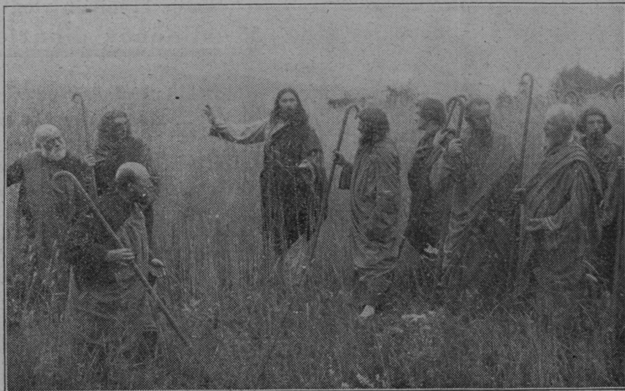
Kristus je šel nekoč s svojimi apostoli preko žitnega polja. Dozorevalo je žito in pričakovalo ženjic, da ga požanjejo in pospravijo. In je učil.