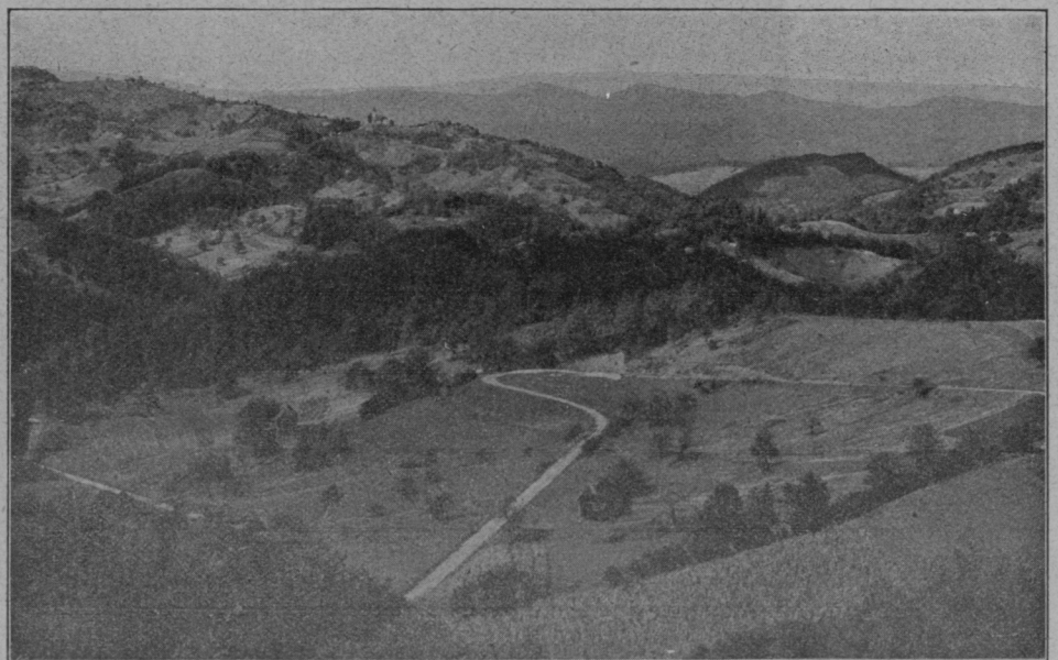
Nova cesta je bila za te kraje krvava potreba in že dolgoletna želja ondotnega prebivalstva.