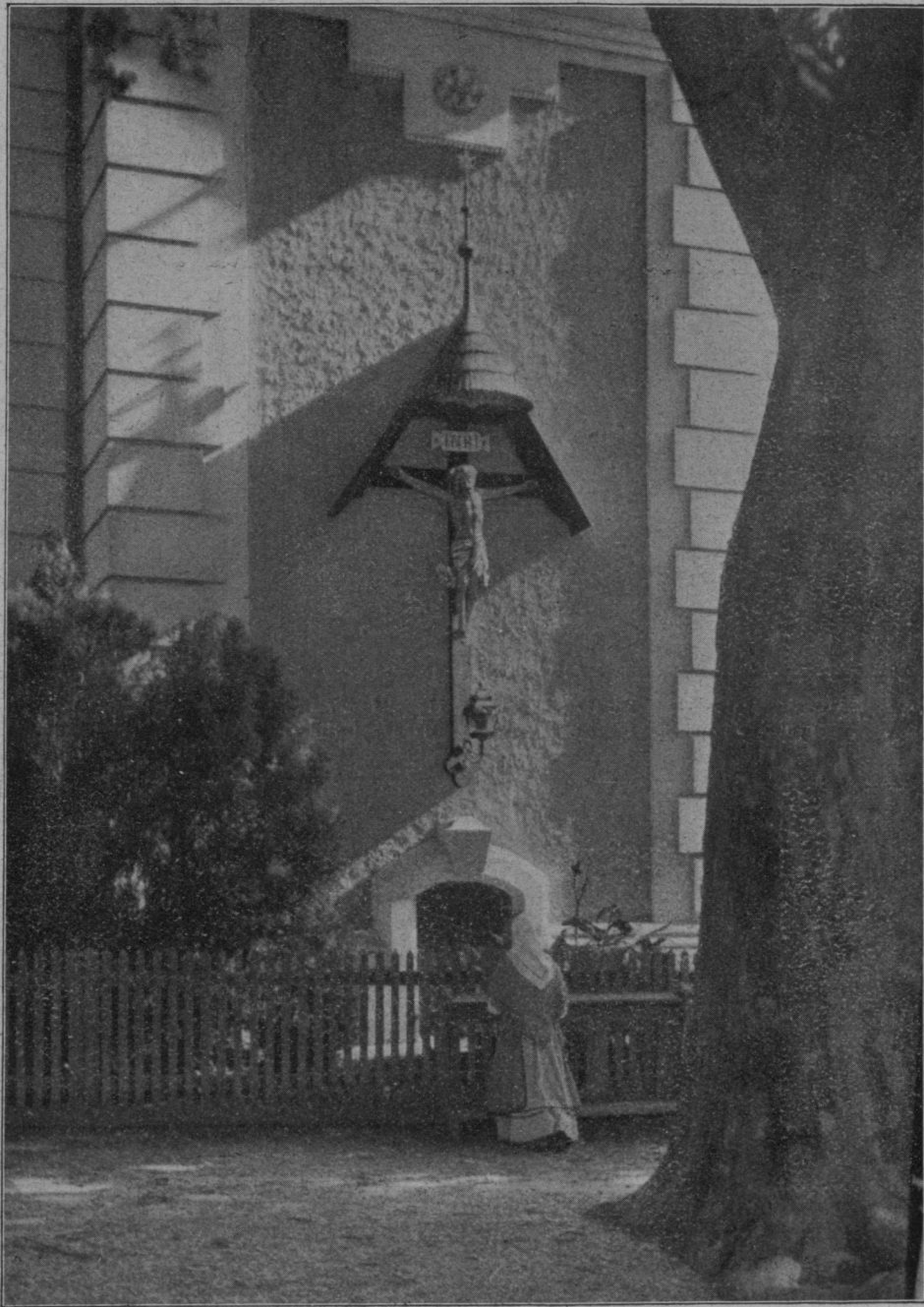
Pomladno jutro pri cerkvi v Beltincih.