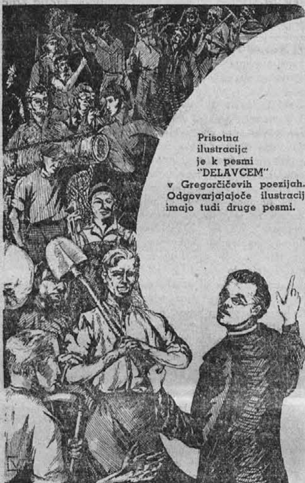
Prisotna ilustracija je k pesmi "DELAVCEM" v Gregorčičevih poezijah. Odgovarjajoče ilustracije imajo tudi druge pesmi.

Suma que iguala la de entradas ..... $ 45.214.51