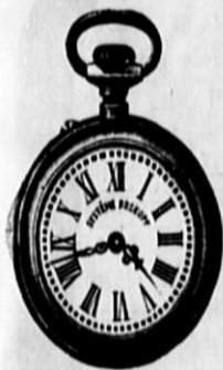
Št. 502. Nikelnasta ankerremontoar-Roskopf, trpežno kolesje, gl. 245, enaka iz pravega srebra gl. 395, ista z dvojnimi tršim srebrnim močnim pokrovom gl. 650 in naprej.

Moške ure, 2 tretjini naravne velikosti.