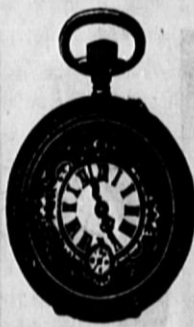
Št. 505. Prava srebrna cilindarremontoar, trpežno kolesje in močni pokrovi, gl. 485, ista z dobrim ankerkolesjem gl. 595 in naprej.