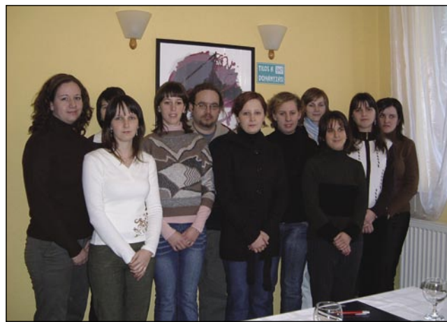
Nekdanji študentje v Ljubljani, ki so večinoma že končali ali so absolventi

mlade formira in informira o možnostih njihovega udejstvovanja in delovanja. Mladinsko organiziranje želimo mladim približati do te mere, da se jih vključuje čim več – tako dijakov kot tudi študentov – ne glede na njihov kraj ali državo izobraže-