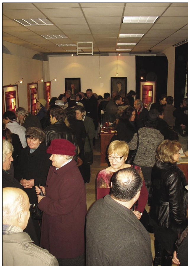
Razstavo si je dosta lüstva poglednilo

Pavlovo leto so oprli 15. januara v Somboteli s programom, šteri se je malo po podnevom začno v salezijanskoj cerkvi, gde so na grob eričnoga slavista, etnologa, profesora in prevajalca polo-