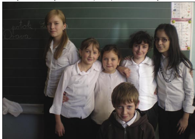
Števanovski učenci, ki so se udeležili tekmovanja v Dobrovniku

Nikom Grafenauerjem in z njegovim rojstnim datumom, s 70-letnico. Pred tekmovanjem so nam poslali