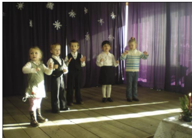
Števanovski malčki na domačem odru

Decembra so bili zelo zasedeni učenci in učitelji na števanovski šoli. Od začetka meseca smo se pripravljali na božič. 6. decembra je prišel v vrtec in na šolo Miklavž. 12. smo imeli božični sejem, kjer smo prodajali lončarske izdelke, razglednice in namizne okraske. 17. decembra so folklorno skupino povabili na nastop v Monošter, kjer je imela srednja strokovna šola »Dan manjšin«. Isti dan popoldne ob dveh smo imeli šolski božič v kulturnem domu. 19. decembra dopoldne ob 11. uri je bil vaški božič v kulturnem domu, kjer so nastopili najmanjši iz vrtca, šolarji, gledališka skupina in ženske pevke. 20. decembra je božiček prišel v vrtec, 21. Decembra pa so šolarji nastopili na Verici na vaškem božiču.