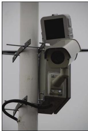
Na dveje mejstaj majo kamere

»Te dveje kamere cejli promet shranijo, ka ga je bilau v 24 vöraj. Nazaj leko pogledne, sto se je v ves pripelo, s kakšnim avtonom, v kelšoj vöri pa s kakšno registracijov (rendsám). Tak dober kejp napravi, ka ešče obraze leko spozna. Nej je baja tau tö nej, če je kmica, zato ka kamera ma eden infra reflektor. Tejva dva reflektorja sta staudvajstigezero forintov, plus prometni davek koštala, dapa brezi tauga bi v kmici kamere nika nej bile vredne. Kamera nej bila draga, 80.000 forintov je koštala, samo te smo ešče mogli küpti vcuj edno hišo, štera, gda je mrzlo, te na toplom drži vse, ka je v njej. Te smo ešče elektriko mogli potegniti do kamere, pa dva akumulatora smo küpli, če bi sfalila elektrika. Tak ka tau je vsevküp koštalo 933.000 forintov.«