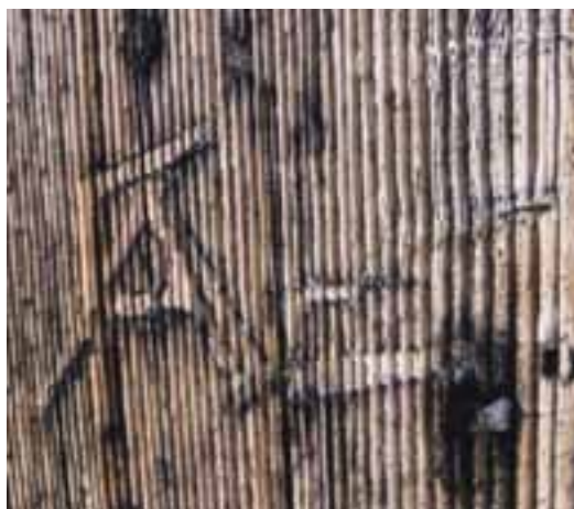
Inicialki »AB« na stanu na Velem polju