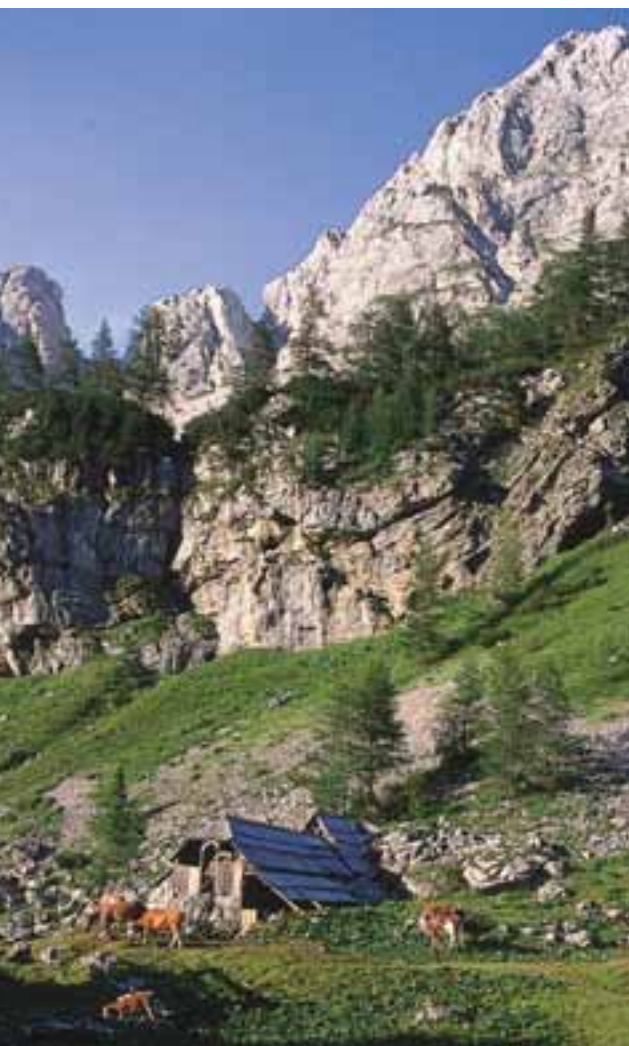
»Hotel Garni für Triglav Kolonisten« na Velem polju