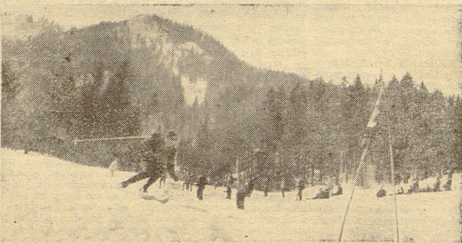
Ugodne snežne razmere so na progi za veleslalom omogočile dokaj hitro in solidno vožnjo.

Glede na toliko število tekmovalcev in tekmovalcev pa bi prihodnjič verjetno bilo umestno izvesti najprej izbirno tekmovalce, kar vsekakor bistveno ne bi vplivalo na povečanje stroškov za zimsko športne igre, le-te pa bi tako kljub doseženi množičnosti, pridobile tudi na svoji kakovosti, predvsem pa se ne bi vleklo od ranega jutra pa tja do srede popoldneva.