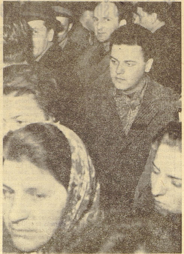
Z zbora delovnih ljudi v splošni montaži v kranjski tovarni