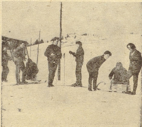
Posnetek z izleta PZ na Samotorico