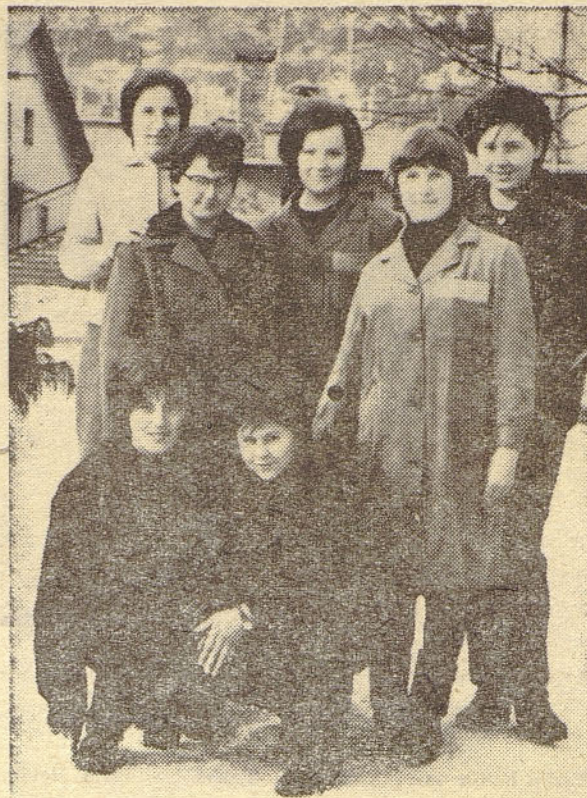
Za zdaj jih je sedem, vendar v strelskem športu govore tako navdušeno, da se bodo zanj ogrela še druga dekleta.

Volitev letos ni bilo in bo dotedanji odbor vodil društvo tudi v prihodnjem letu. Prostovoljnim gasilcem v tovarni »Iskra« želimo tudi vnaprej mnogo uspehov;