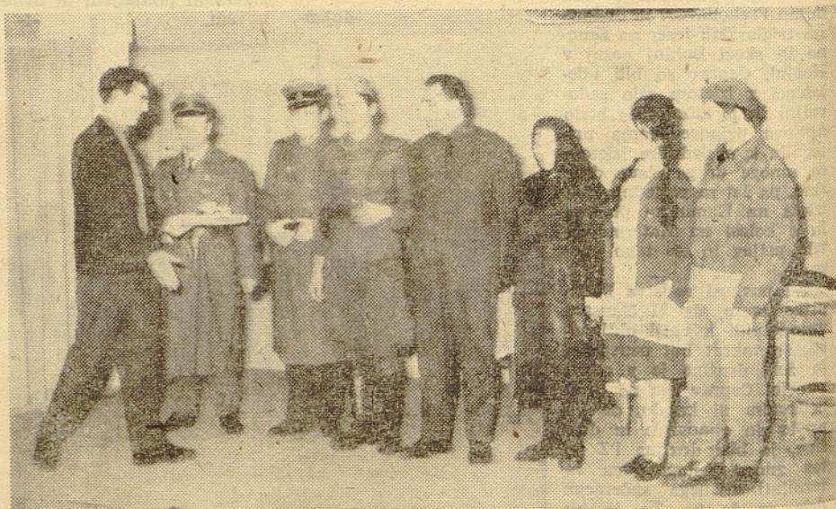
Na čast dneva žena je igralska skupina v tovarni elektronskih naprav uspešno izvedla eno dejanko »Sanjec. Na sliki: nastopajoči s svojim režiserjem po končani predstavi.