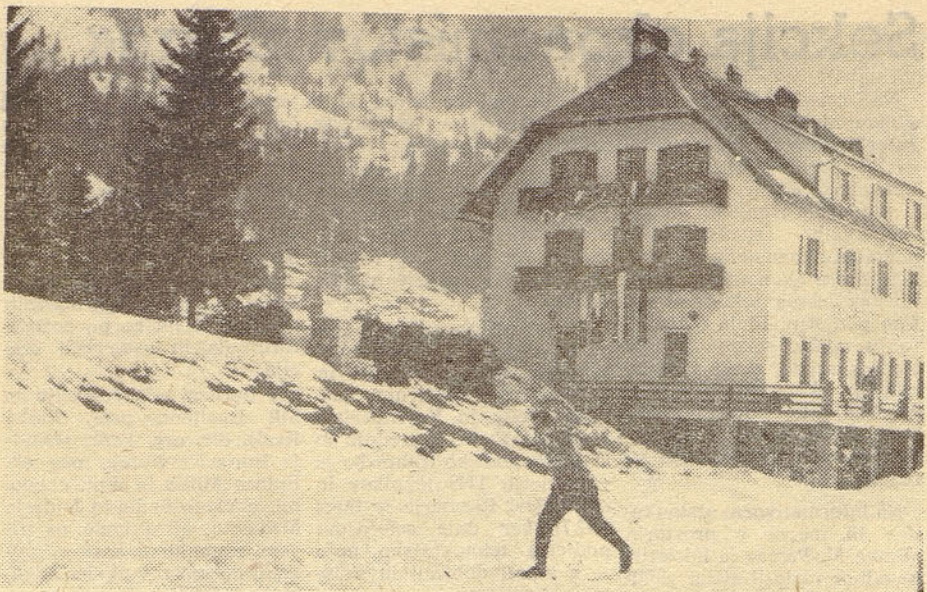
Letos je tradicionalne zimsko športne igre Iskre organiziral Zavod za avtomatizacijo in dosegel rekordno udeležbo, manjši uspeh pa pri sami organizaciji. Na sliki: s tekmovanja v smučkem teku

Petemu Kongresu Zveze komunistov Slovenije želimo najplodnejše delo. Naj bo tudi ta kongres podobno kot VIII. kongres Zveze komunistov Jugoslavije zares naš kongres, kongres teženj in hotenj vseh naših delovnih ljudi!