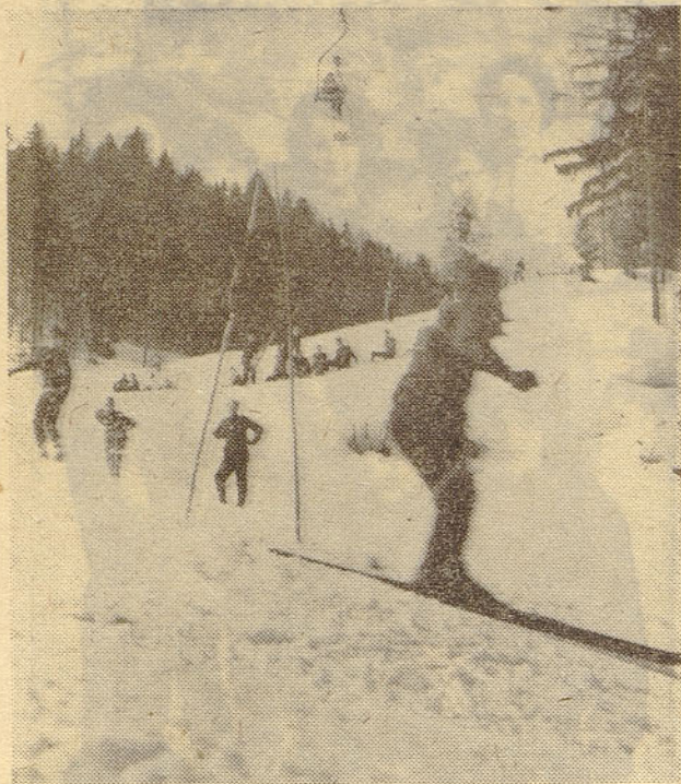
Vsako leto v razredu starejših članov nastopajo številni tekmovalci