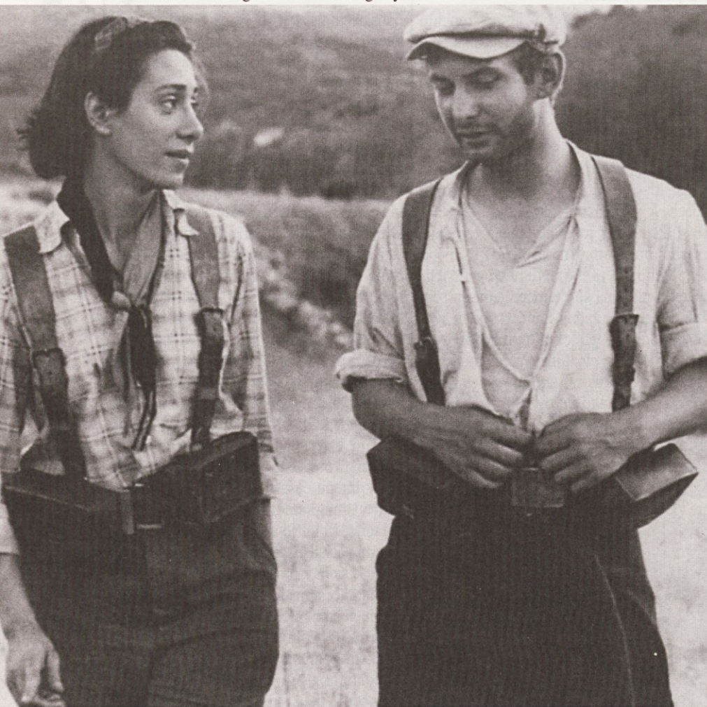
Rosana Pastor in Ian Hart v filmu Zemlja in svoboda