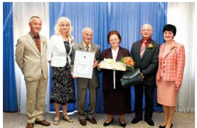
Zakonca Lampret z otroki

Regijski center za obveščanje Ptuj vas obvešča, da v primeru požara, nesreče ali drugega dogodka pokličete na tel. številko 112. Najdete jih na Slomškovi 10 na Ptuj, tel. številka (02) 771 34 61 ali 771 00 31, elektronska pošta: dragomir.murko@urszr.si.