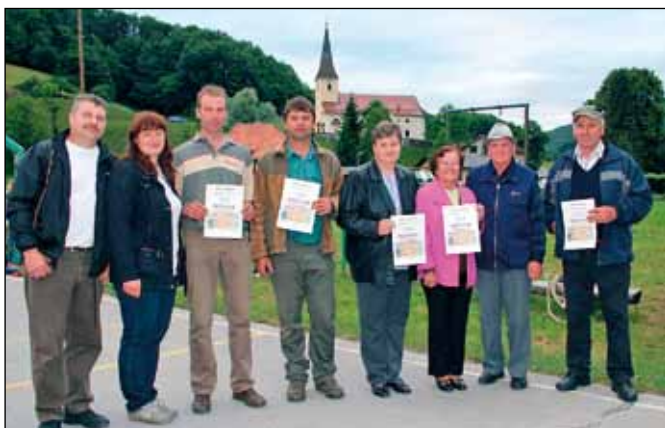
Večina dobitnikov je priznanje prejela na Kmečkem prazniku v Stopercah