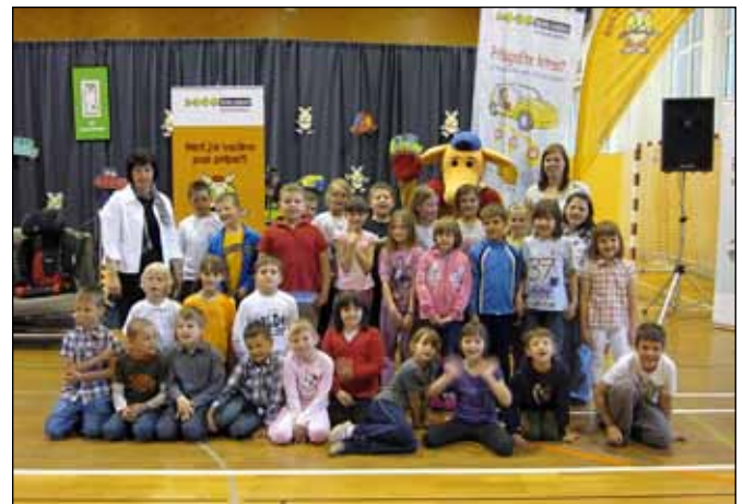
Vsi udeleženci v projektu

V aktivnosti smo vključili tudi naše starše, ki so se odzvali in sodelovali po potrebi. V našem projektu