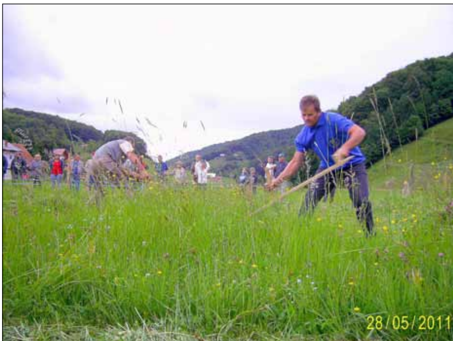
Tako so v Stopercah tekmovali kosci!