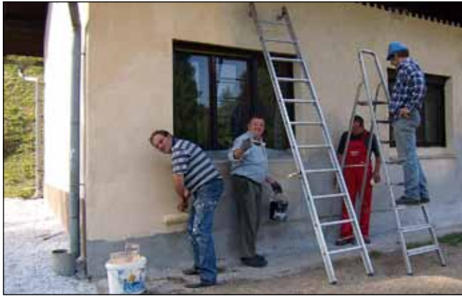
Pleskanje zunanosti nekdanje učilnice