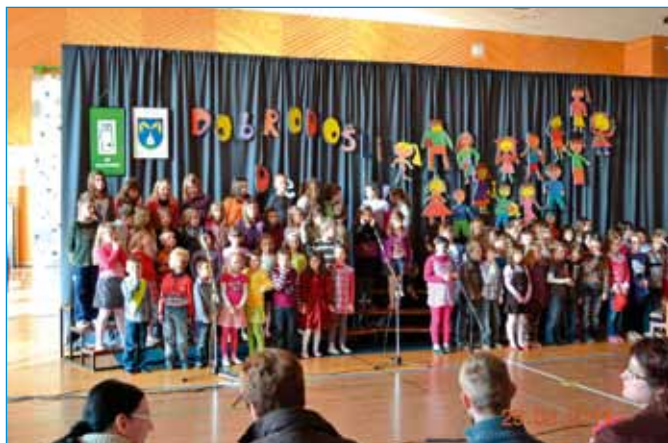
Šolsko leto se bliža h koncu, o številnih prireditvah in Dnevu pomladi pa na strani 20.