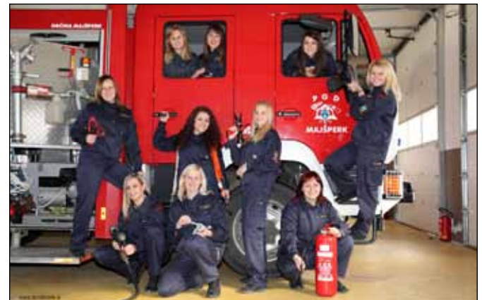
Zmagovalne članice 112

Približeval se je mesec marec in z njim tudi pomlad. Polne adrenalina in brez spomladanske utrujenosti smo odšle na tekmovanje v Novo Cerkev pri Celju. Tam so začeli »padati« najboljše časi vaj med člani, kjer so prvič prebili magično mejo 16 sekund. Tudi časi članic so bili zmeraj boljši. To smo ponovno dokazale me, saj smo s časom 18,48 sekund zmagale. Po teh štirih sklopkih tekmovanj je bilo prvo mesto v skupnem seštevku že v našem žepu. Na peto oz. zadnje tekmovanje smo odšle popolnoma neobremenjene. 26. marca smo v Žažar prišle po najmanj en pokal, ki simbolizira zmago v skupnem seštevku. Kljub temu, da smo zmago v skupnem seštevku imele potrjeno, smo vztrajale do konca. Ta vztrajnost nas je pripeljala do finalnega nastopa. V Žažarju smo živele svoje sanje, saj smo postavile osebni in tudi državni ženski rekord v spajanju sesalnega voda s časom 17,86 s. Domov smo se vrnile s štirimi pokali in z naslovom pokalnih prvakinj v spajanju sesalnega voda. K vsemu temu pa so na nek način pripomogli naši navi-