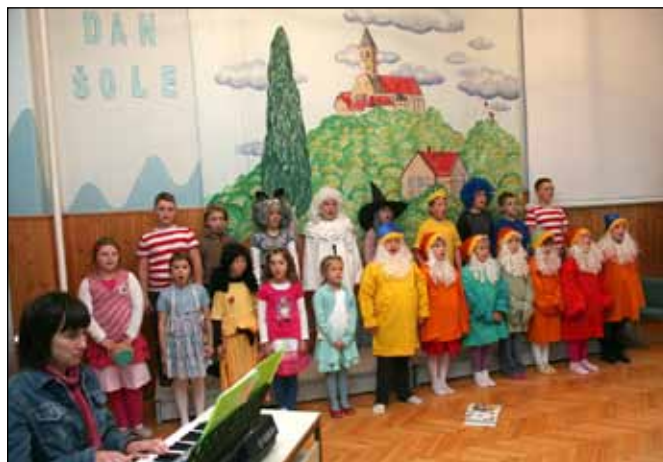
Takole so dan šole praznovali na Ptujski Gori