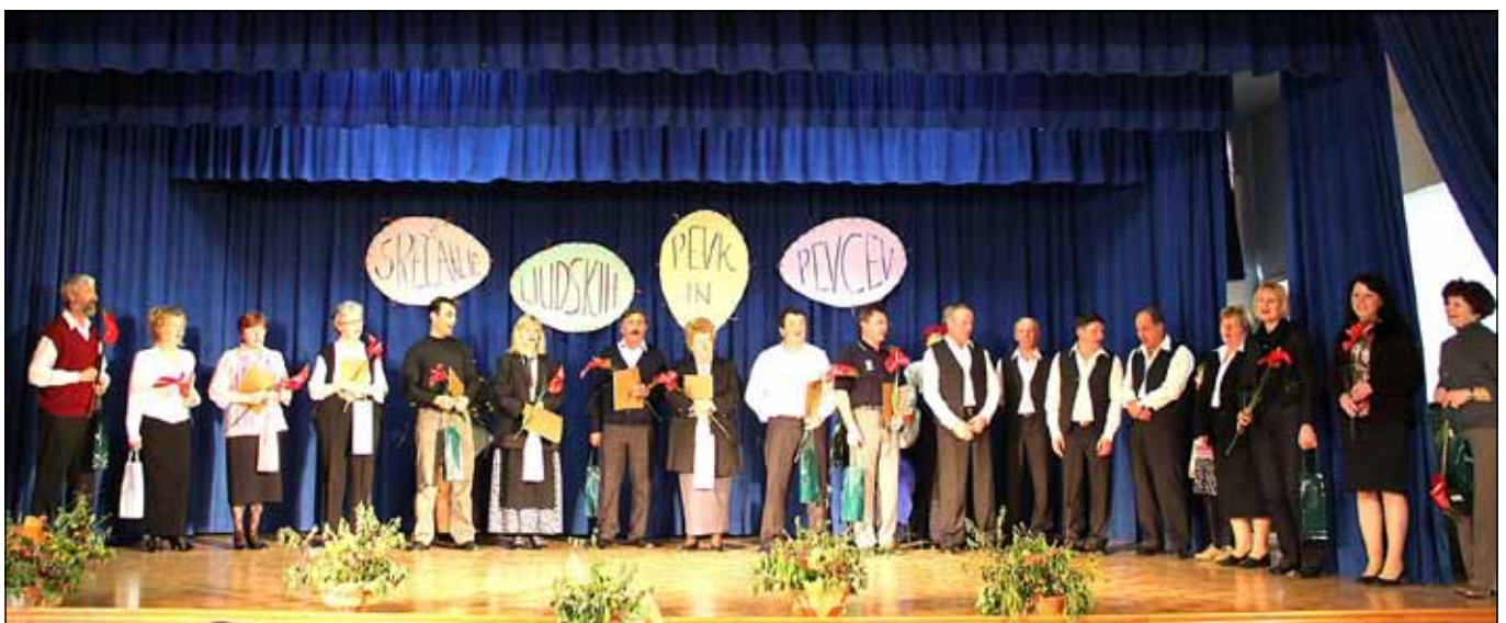
Vodje vseh sodelujočih skupin skupaj z županjo Občine Majšperk in organizatorji