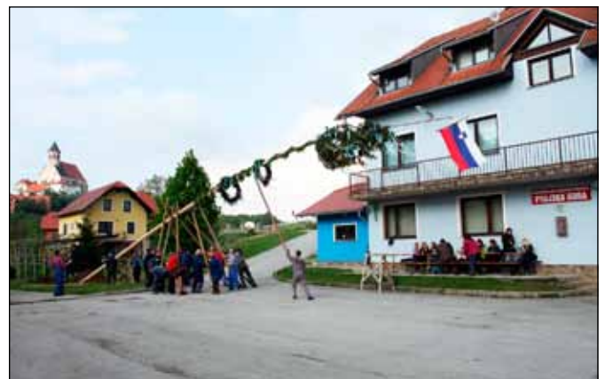
Tako so na Ptujski Gori postavili majske drevo