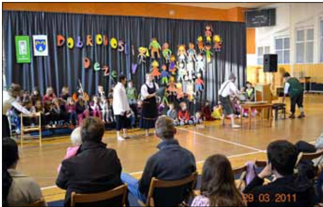
Na prireditvi so nastopili tudi člani KPD Stoperce s Kekcem