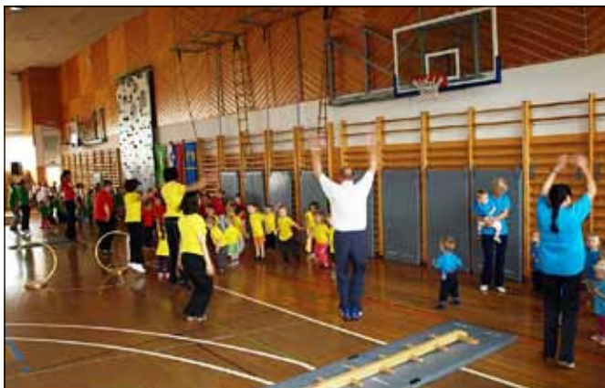
Takole so se skupaj s starejšimi gibalni najmlajši

Ptuj, obiskovali so plavalni tečaj in se spopadajo s tekmovanjem Zlati sonček, kjer še kolesarijo, hodijo na izlete, se žogajo...Vsi skupaj smo otroci vrtca Majšperk in na prireditvi smo pokazali, kako