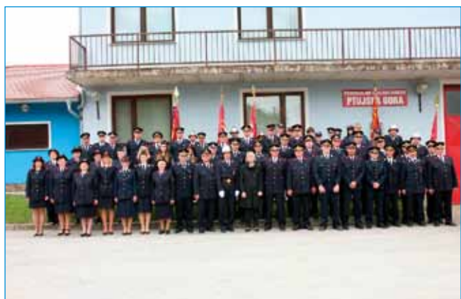
Članice in člani PGD Ptujška Gora, več o njihovi prireditvi na strani 12.