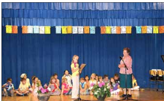
Z zdravilnimi zelišči imajo največ izkušenj naše babice