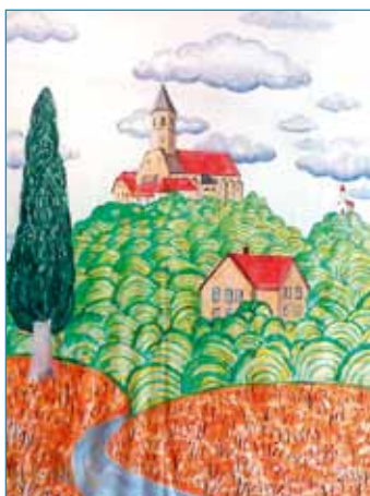
Dan šole so obeležili na OŠ Ptujška Gora, več o šolskem delu na strani 18.