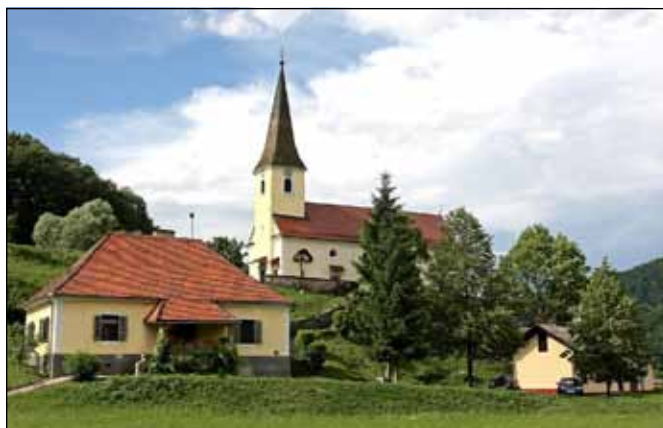
Sveti Frančišek A., ki je ljubil samoto in revno življenje, bi gotovo z veseljem prebival tukaj. Ljudje bi ga zaradi njegove skromnosti zagotovo imeli radi

skala tudi prepotrebna notranjost župnišča, k pleskanju fasade nekdanje učilnice pa