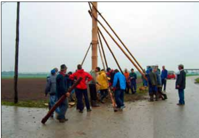
Postavljanje mlaja na Sestržeh