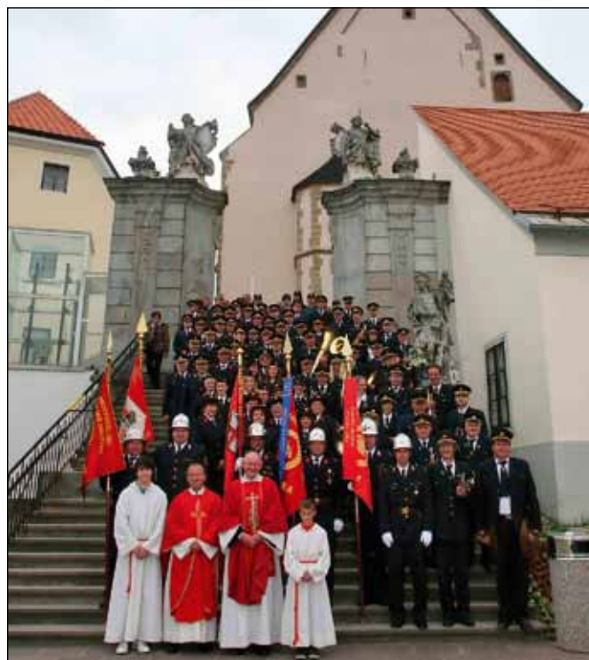
Zbrani gasilci pod cerkvijo Marije zavetnice s plaščem

Po koncu maše smo slovesno odkorakali iz bazilike in se ustavili na stopnišču, kjer je sledilo skupno fotografiranje. Domači poveljnik je uniformirane gasilce postrojil na trgu Ptujске Gore, od koder se je ešalon na čelu