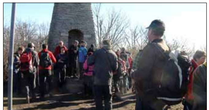
Na Donački gori

Pot smo začeli v Hrastniku in se kar hitro dvigovali proti cerkvi na Gorah. Ob 520 let stari cerkvi sv. Jurija smo malo počivali in se s pogledom sprehajali po okoliških hribih. Dan ni bil ravno radodaren s soncem, a so bili oblaki dovolj visoko, da nam niso zakrivali pogleda. Pod do doma na Kopitniki