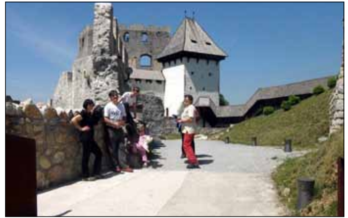
Celjski grad v soncu

Tudi pohod na Celjsko koč smo kar nekaj let prestavljali. Tudi letos nam ni uspelo napolniti avtobusa. Z avtomobili smo se zapeljali do Pečovnika in se po položni poti vzpenjali proti Celjski koči. No ja, to sploh ni več koč, saj je sedaj namesto koč hotel. Turizem se pač seli tudi v hribe. Topla in sončna nedelja je privabila pohodnike in turiste. Vrvež in gneča nas nista ravno