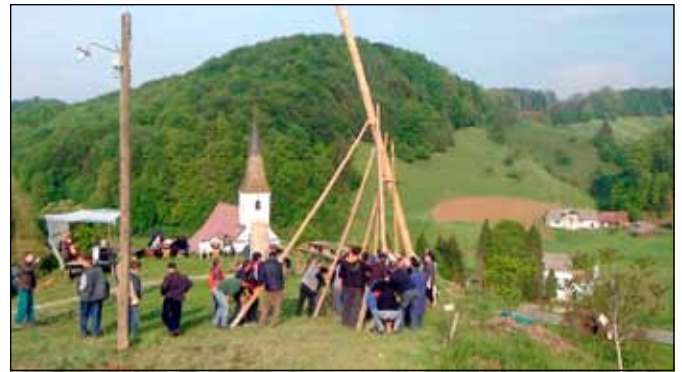
Tako se je postavljalo majskega drevo v Stopercah

Marjana Kamenšek, PD Donačka gora Stoperce