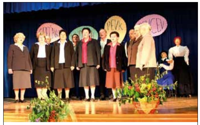
Pevke ljudskih pesmi KPD Stoperce in Pevci ljudskih pesmi »Prešmentani faloti«