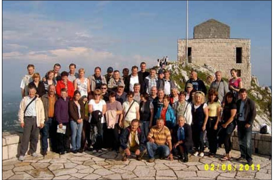
Še ena skupina na Lovčenu.

Strojni krožek Posestnik je tokrat svoj kompas obrnil proti Črni gori in jo