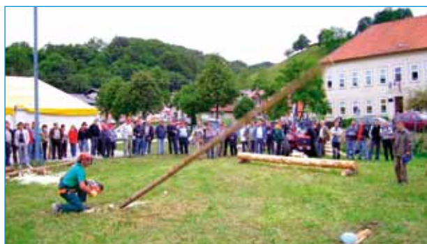
Na Kmečkem prazniku v Stopercah je bilo veselo, več o prireditvah na strani 10.