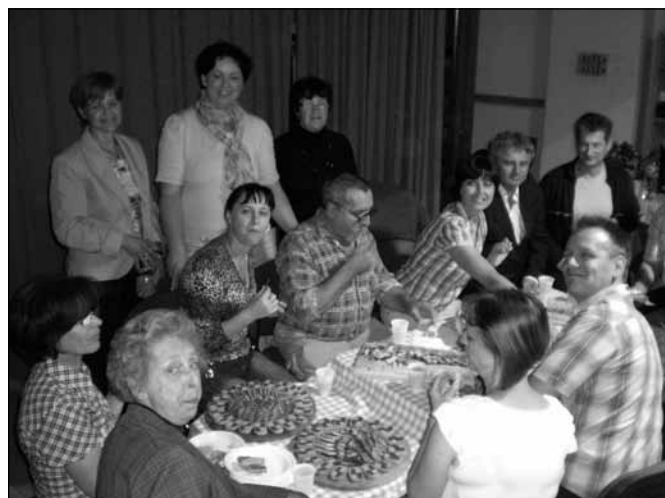
Ustvarjalci po igri skupaj z gostiteljicami

od društev, ki poskrbijo, da je to resnično pravi praznik in hkrati ponos za vsakogar, ki je kakorkoli povezan z izvedbo dogajanja v tem času. Eno izmed izjemno aktivnih društev je tudi Društvo podeželskih deklet in žena, ki je "krivo", da se je dramskasekcija Umetniškega društva Ustvarjalec smela pokazati v malo bolj oddaljeni občini. Zaključni vikend dogajanj ob občinskem prazniku je bil 28. maja 2011, ko smo "ustvarjalci" ob 19.00 uri v prostorih selniškega kulturnega doma odigrali našo dobri