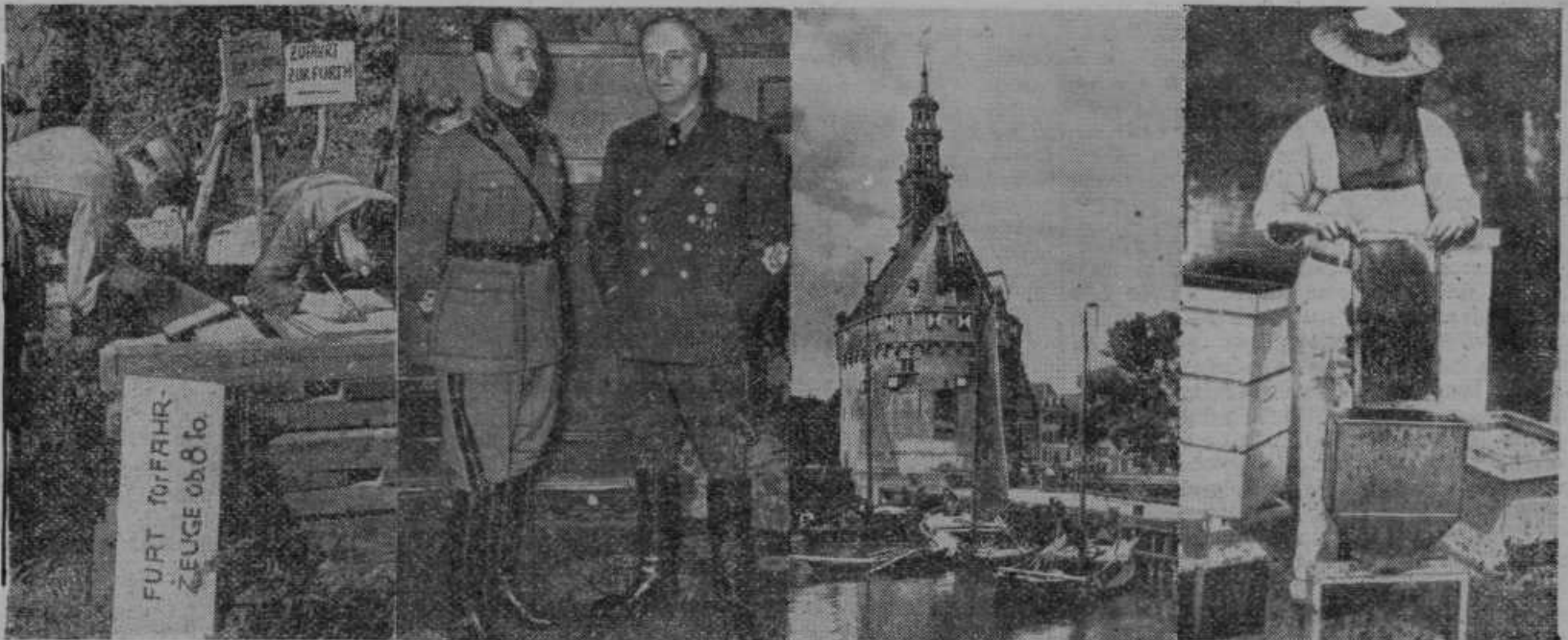
Nemški vojaki rišejo in pleskajo po zasedbi Belgije kašipote za nemško vojaštvo

Sovjeti in cerkve. Angleški katoliški listi poročajo o postopanju sovjetskih oblasti s cerkvami na Poljskem. Po zasedbi Poljske so sovjeti več cerkva zaprli, na vztrajno zahtevanje prebivalstva pa so jih morali zopet od-