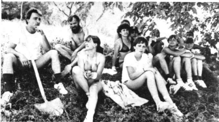
Krški brigadirji – zlasti brigadirke med redkimi trenutki oddiha v senci in pri „storitveni dejavnosti“ (mala slika)

Vsem, ki se udarniške akcije niso mogli ali hoteli udeležiti, prenašamo gromki brigadirski: Z-D-R-A-V-O! ZDRAVO! ZDRAVO! ZDRAVO!