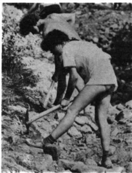
Tudi dekletom v brigadi ojeklenijo mišice.

9. julija se je Izvršni svet SO Krško sešel na svoji 7. seji in obravnaval naslednjo problematiko: potrdil je sklepe 6. redne seje in izredne seje, sprejel ustrezne sklepe glede zazidalnih načrtov za območja Leskovec – Gmajna, Brestanica – Dorc, ob cesti Brestanica – Senovo ter industrijska cona Žadovinek – Spodnji grič II, razpravljajl je o sanacijskem programu gramoznic Drnovo in Brege in zavzel stališče o predlogu IGM Sava Krško za razširitev gramoznic na Bregah, poleg tega pa so bile na dnevnem redu še variante hitre proge Ljubljana – Dobova, predlog odločbe o ugotovitvi splošnega interesa za izkoriščanje gramozna na lokaciji gramoznice Stari grad in predlog sklepa o imenovanju občinskega štaba za civilno zaščito.