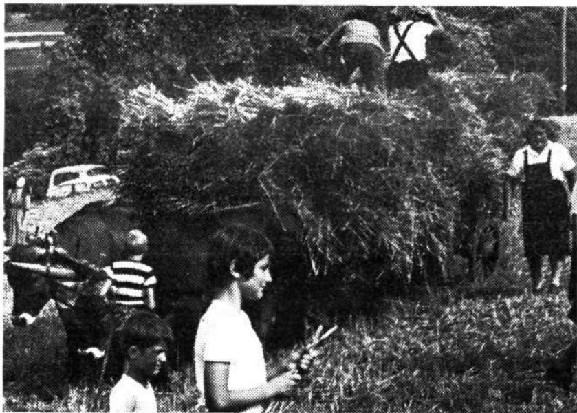
Mladje: med prikaz običajev je sodilo tudi nalaganje žita na voz, spravilo v kozolec, mlačev rži in izdelava škope za kritje streh