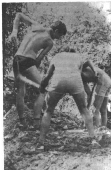
Ce hočeš spraviti v vodoravni jarek toliko kamenja, je treba družnih moči!

Meja območja za Senovo poteka od severozahodnega vogala parc. št. 711/2 k. o. Senovo ter teče po severni meji te parcele v smeri vzhod po severnih mejah parc. št. 359/2, 353, 364/1 in 366/4, kjer se ob severovzhodni meji te parcele obrne proti jugu in poteka dalje po vzhodnih mejah parc. št. 366/3, 366/1, 367/1, stab. parc. št. 145 in 144 ter ob vzhodni meji parc. št. 551/1 in se ob južni meji te parcele obrne proti zapadu ter poteka nato ob južnih mejah parc. št. 551/4, 551/3, 359/2 preko ceste Brestanice – Senovo parc. št. 711/2, ob južnih mejah parc. št.