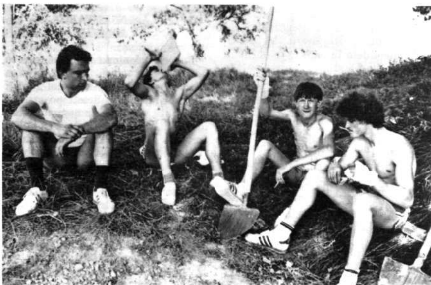
Nikar ne mislite, da brigadirji samo posedajo v senci. To je le nujen oddih, ki omogoča nadaljnje delo.

Delegatom skupščine predlagamo, da zbori skupščine pooblastijo izvršni svet Skupščine občine Krško, da le-ta ugotavlja v katerih TOZD je nastala izguba posledica povečane amortizacije in na osnovi ugotov-