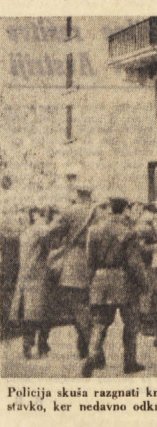
Policija skuša razgnati kmete v Materi (Basilicata), kjer so protestirali s splošno stavko...