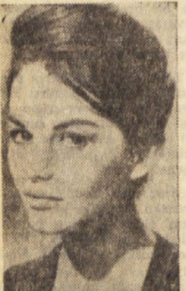
CLAUDIA CARDINALE, ki se je tako naglo povzpela v filmskem svetu...