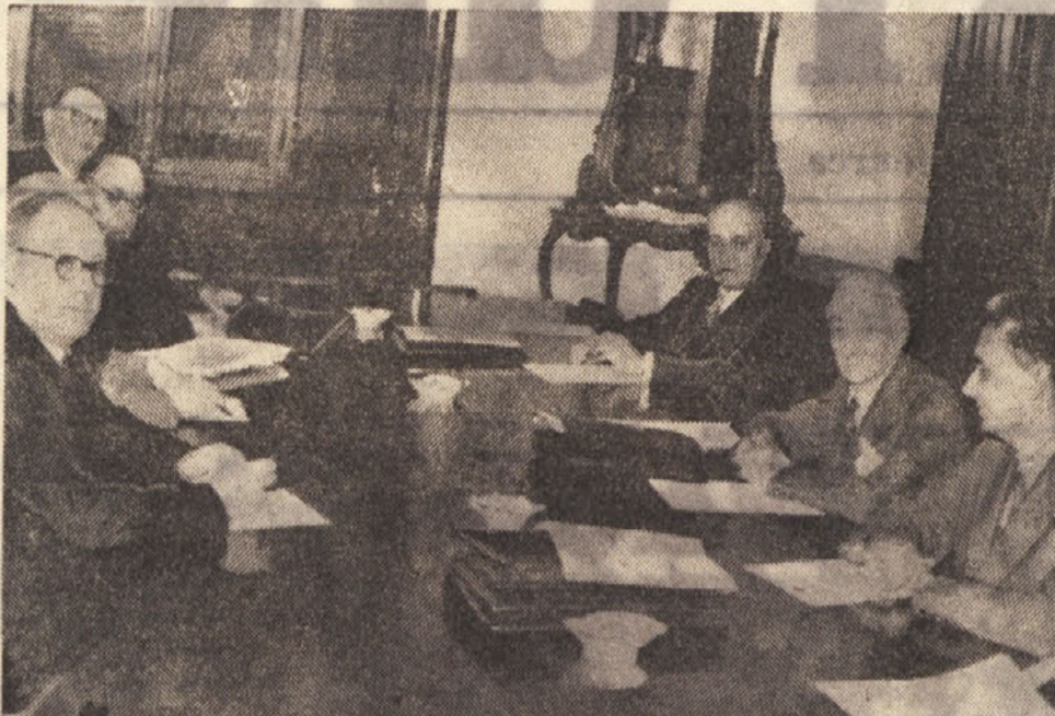
Segni je za danes prekinil svoja posvetovanja v zvezi s sestavljanjem nove vlade...