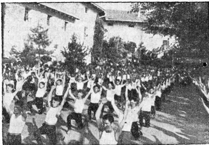
Telovadni nastop v Dornbergu.

Najbolj so gledalcem ugajali malčki. Ne sicer zato, ker so najpreziceznejše telovadili, pač pa zato, ker so kazali resnost in skrb, ki bi jo človek otrokom ne prisodil.