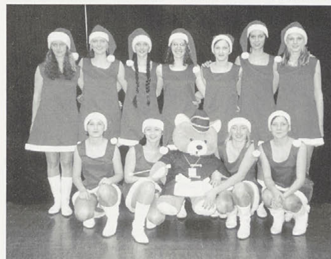
Trebanjske mažorete s svojo maskoto

Občinski pihalni orkester Trebnje je tako pripravil še en prijeten večer, ki jih v Trebnjem tako ni veliko. Da pa je lahko večer uspel, se mora orkester zahvaliti vsem sponzorjem in seveda OŠ Trebnje, ki je ponudila športno dvorano. Darja Korelec