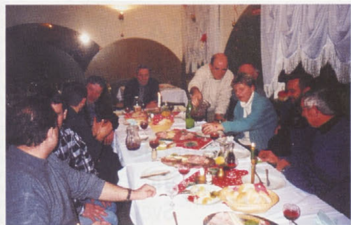
Prednovoletno srečanje krajanov KS Blato ob zaključku osvetlitve vasi. T.Z.

V počastitev častiljivega jubileja bo v nedeljo, 14. januarja ob 11. uri, na novomeškem kegljišču Vodnjak naša vrsta gostila državno žensko reprezentanco. O izidu srečanja bomo poročali v naslednji številka Glasila občanov.