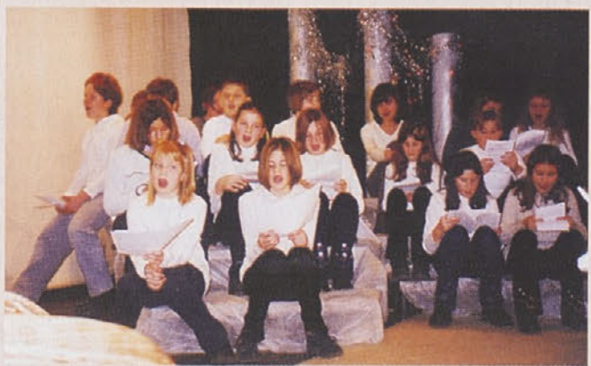
Pevci GŠ Trebnje pred prihodom dedka Mraza