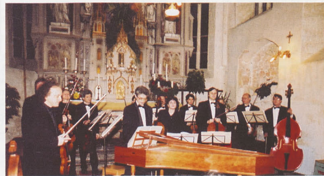
Kljub mrazu v gotski cerkvi smo se ogreli ob zvokih solistov iz St. Petersburga.