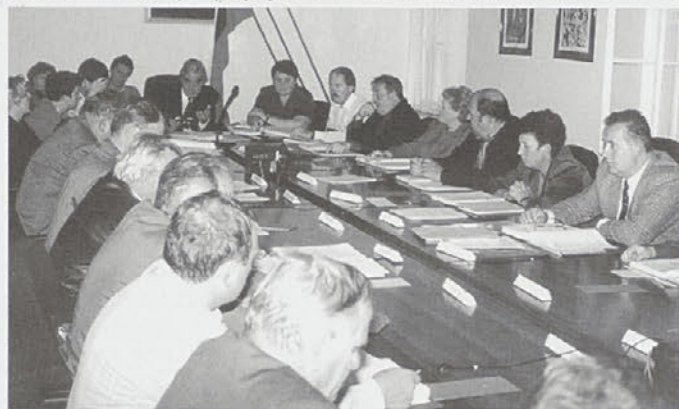
Na seji OS