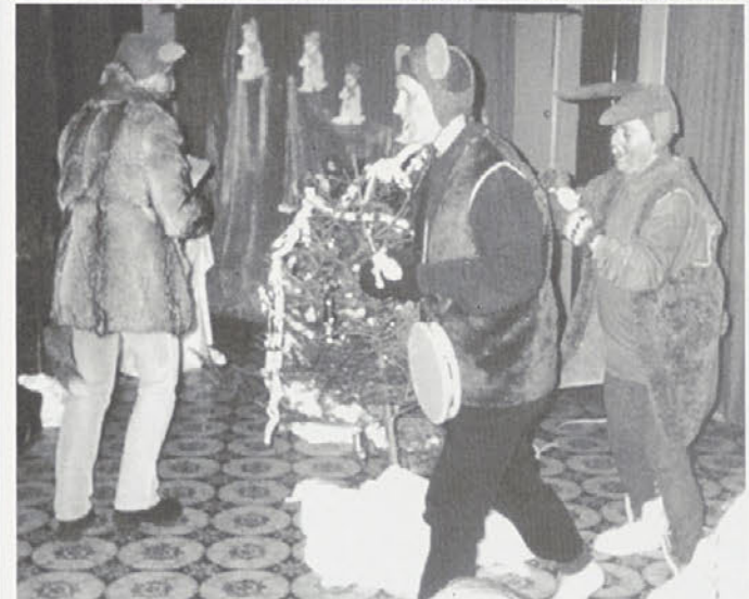
Didel, didel, daja, dedek Mraz prihaja, so prepevale gozdne živali v predstavi, ki so jo uprizorile članice skupine Biba iz VVZ Trebnje

Obisku dedka Mraza so se Mokronog, in Bibe iz Trebnje pridružile še ena od skupin njega, šoferju, ki je potrpe-