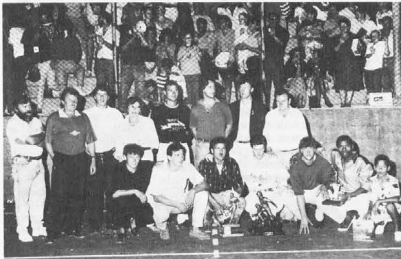
La Polisportiva Tribil detentrica del trofeo

Legno più - Cividale/Topolo Pegliano - Pro Clenia