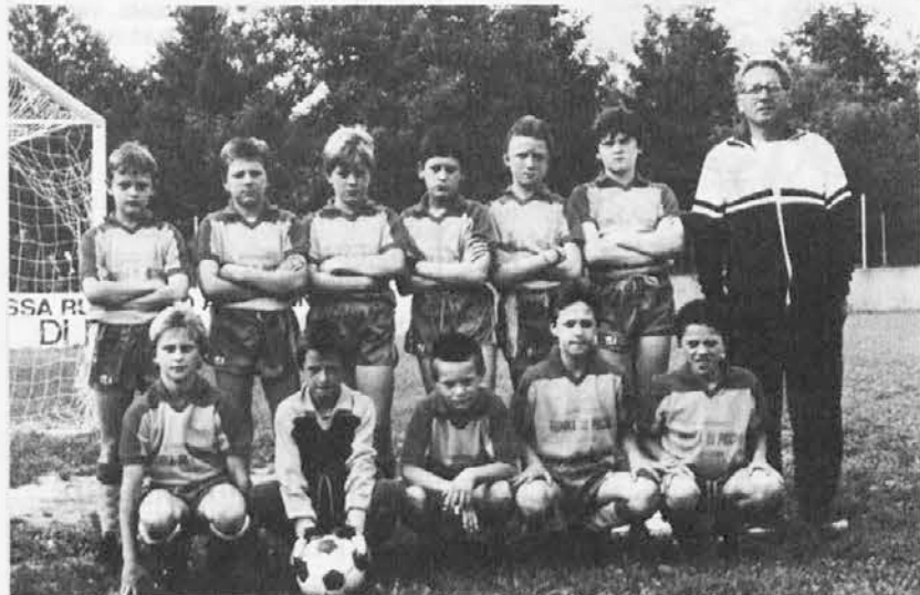
I ragazzi prima della gara di Premariacco, terminata 9-9