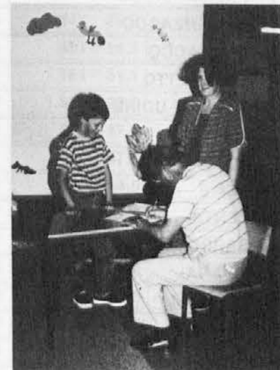
Otroci 3. razreda so prejeli pa Bevkovo značko