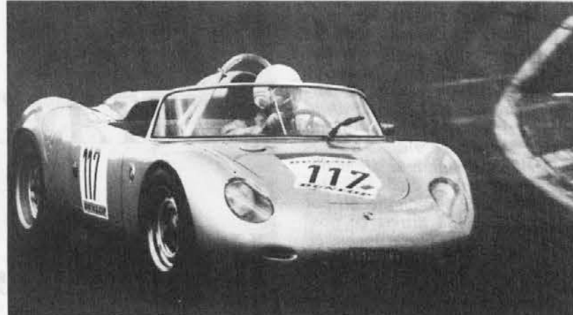
Un concorrente della scorsa edizione

1. raggruppamento - Vetture costruite prima del 31-12-1957