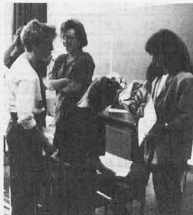
V 3. razredu med podelitvijo sprečeval

Un ottimo punto di avvistamento su tutta la valle... in comunicazione "visiva" con gli altri campanili, che spiccano tra il verde intenso delle montagne circostanti con torri isolate: intelligente strategia di difesa dagli attacchi dei nemici.