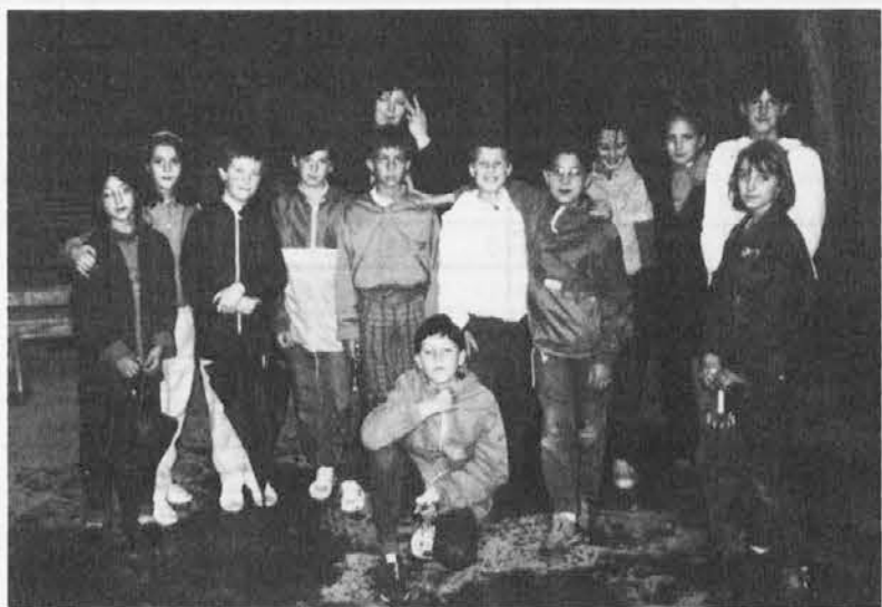
I bambini della 5ª della scuola elementare di Udine che hanno visitato le valli del Natisono nella grotte d'Antro

Un bambino udinese e la visita della sua classe al Centro bilingue e ad Antro