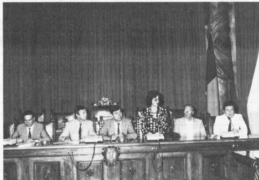
Un momento della presentazione