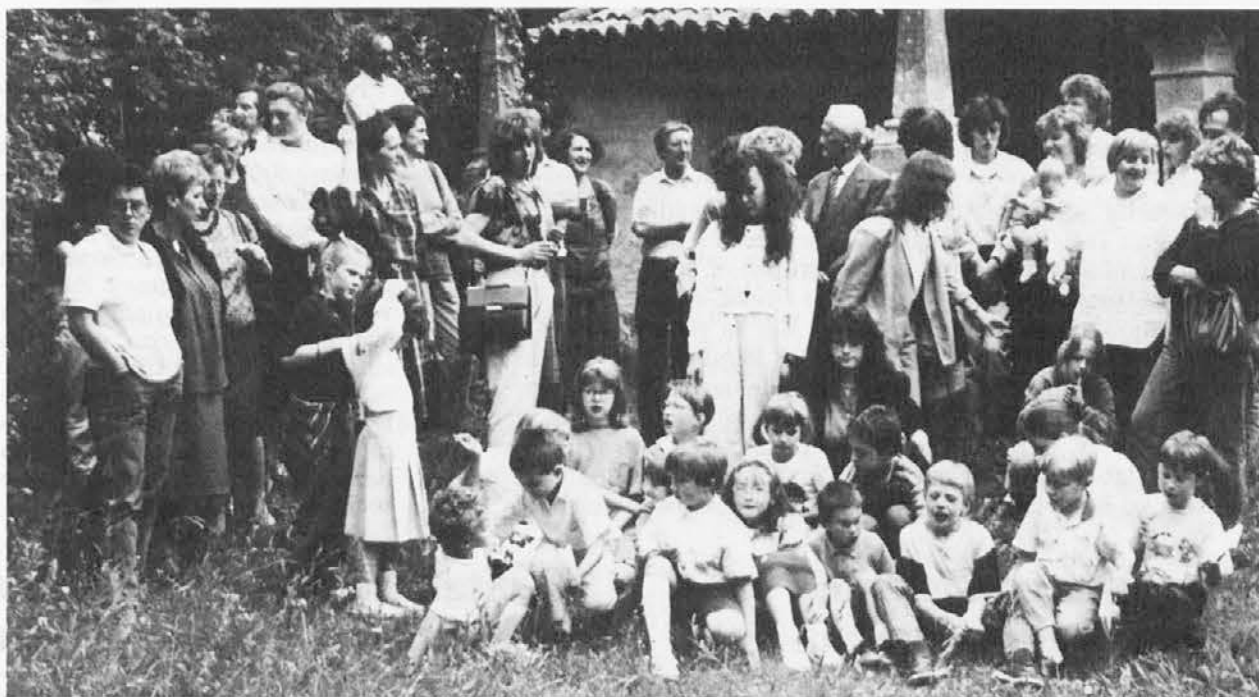
Foto di gruppo davanti alla chiesetta di Biacis dopo la messa celebrata da msgr. Pasquale Guion a conclusione dell'anno scolastico

Prišeu je potle tisti moment, ki so ga otroci, in seveda tudi starši, najbolj težko čakali: spričevala. Vsi so dobro delali in zato je jasno, de prestopijo v naslednji razred. Naj povemo pri tem, da njih znanje so preverili na izpitu. Za te najmlajše, ki so hodili v prvi razred, je bilo morda buj lahko, saj jih je spraševala notranja komisija. Otroci iz drugega in tretjega razreda so pa šli na izpit v Gorico, kjer so morali pokazati, kaj so se navadili