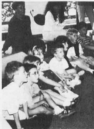
V 1. razredu so dobili srebrno cicibanovo značko