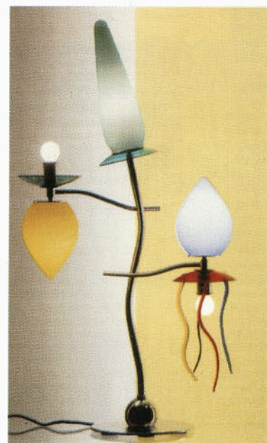
Artemide - nova smer 1999