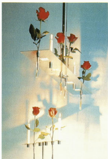
Tudi to je lesteneč - na viseči plošči iz aluminija je še prostor za rože in svečnike (Nimbus design)

Steklarno Hrastnik novo tehnološko znanje. Takšna platforma pa je omogočila novo programsko sodelovanje z največjim kupcem - RZB (l. 1992), kar je po daljšem obdobju Steklarno Hrastnik ponovno pozicioniralo v Evropi. Posledično je pridobila nove kupce (Putzler, Meltermi) in se visoko uvrstila v tehnološkem pogledu.