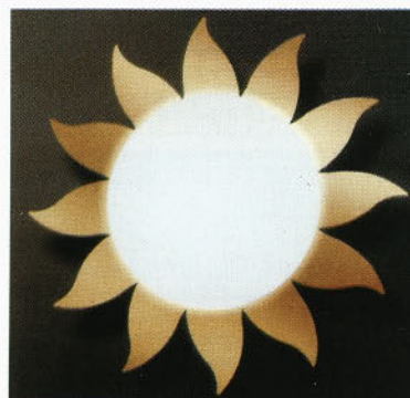
Figure kot svetila - sonce, luna, zvezda (Casablanca)

Steklarne Hrastnik je v dveh desetletjih izgubila prednosti iz preteklih obdobij. Potrebna je bila nova energija, novi izzivi. To je bilo začeto sodelovanje s firmo Limburg (konec 80-tih let), ki je prineslo v