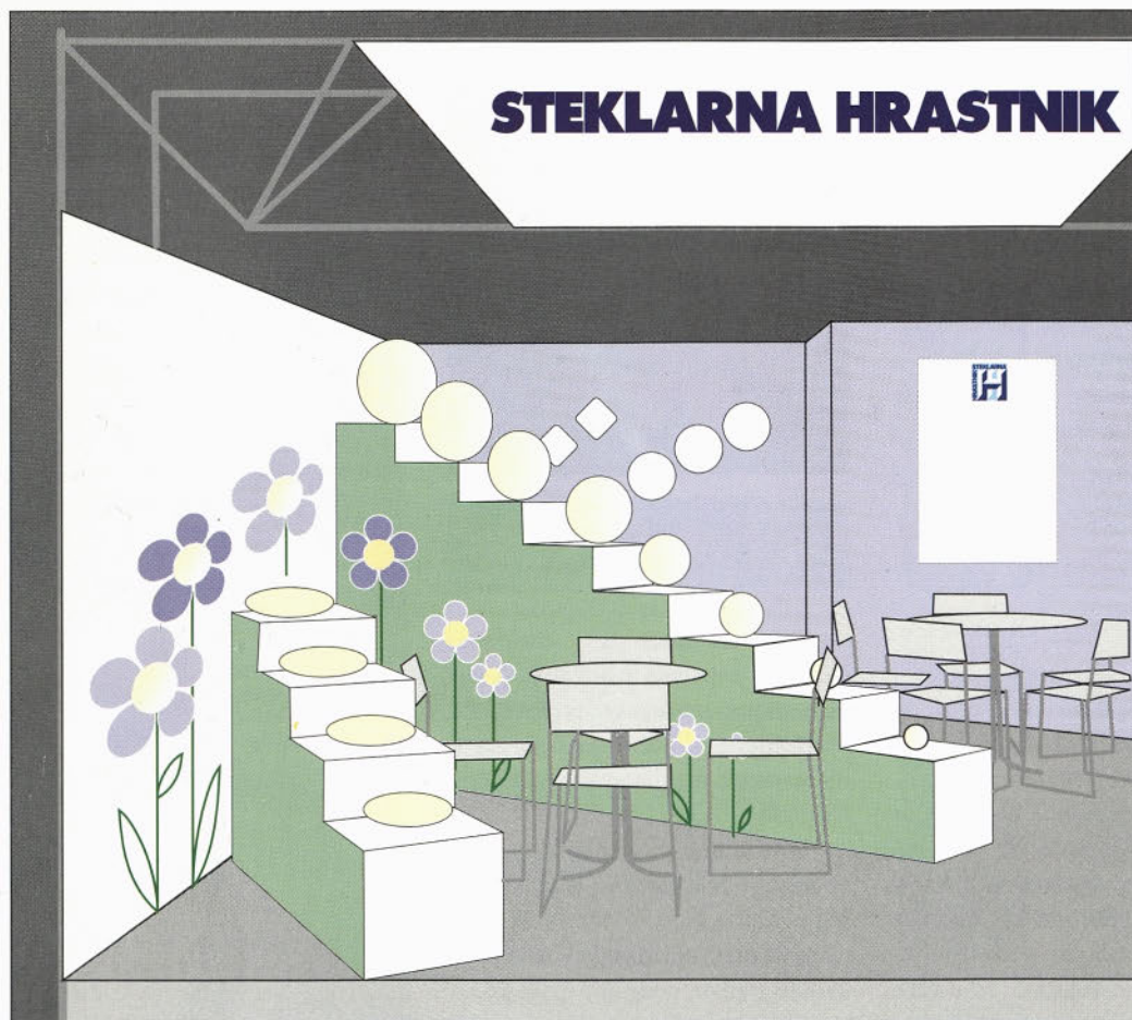
Grafična predloga našega razstavnega prostora v Hannoveru