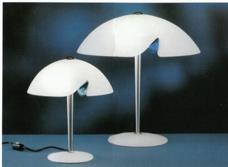
Namizni svetilki iz opala - s steklenim vložkom (AV Mazzega)

Svetovna razstava svetil v Hannoveru je enkratna priložnost za preverjanje naše poti oz. usmeritve na področju razsvetljavnega stekla. Osebo spremljam trende na področju razsvetljave od l. 1966 (sejem v Hannoveru sem prvič obiskal l. 1972), pa vendar ostajajo nekatere zakonitosti te branže v veljavi še danes. Gre za temeljno izhodišče uspešnosti - biti prepoznaven (danes rečemo biti "in") v neizprosni svetovni konkurenci ali pa te slej ko prej