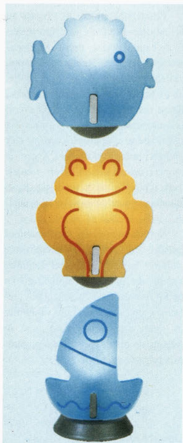
Leola - stenske figure (otročka svetila)

Pomembna značilnost tega obdobja je bila tudi rast hrastniškega proizvajalca svetil - Sijaja. Iz neznanne obrtne delavnice je v desetletju nastalo veliko podjetje, največje in vodilno v takratni Jugoslaviji. Ekspanzijo razvoja razsvetljavnih stekel v Steklarni Hrastnik so namreč