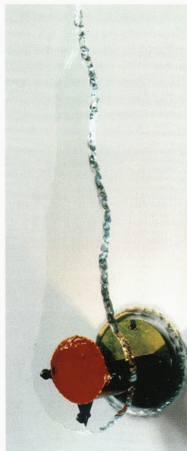
Umetniški izdelek iz stekla - stenska svetilka (Lalini)

Ocenjujem, da na kvaliteti in produktivnosti v Steklarni ne moremo storiti toliko, da bi si lahko v konkurenčnem boju še tudi v prihodnje zagotavljali polno zasedenost vseh brigad in dolgoročen razvoj ter socialno varnost vseh zaposlenih v PC razsvetljava. Potrebno je redefinirati razvojno politiko programa razsvetljave, poskrbeti, da se bo v programu dinamično povečevala dodana vrednost, v okviru katere bo prostor tudi za realno rast plač zaposlenih. Steklarna bo morala postati tudi proizvajalec gotovih svetil z dominantno vlogo vrhunsko oblikovanega kvalitetnega opalnega stekla. O tej temi smo že razpravljali tudi na seji Nadzornega sveta, dne 15.9.1999, kjer sem člane informiral o svojem videnju realizacije tega pro-