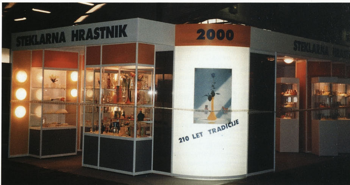
Naš razstavni prostor na zagrebškem sejmišču