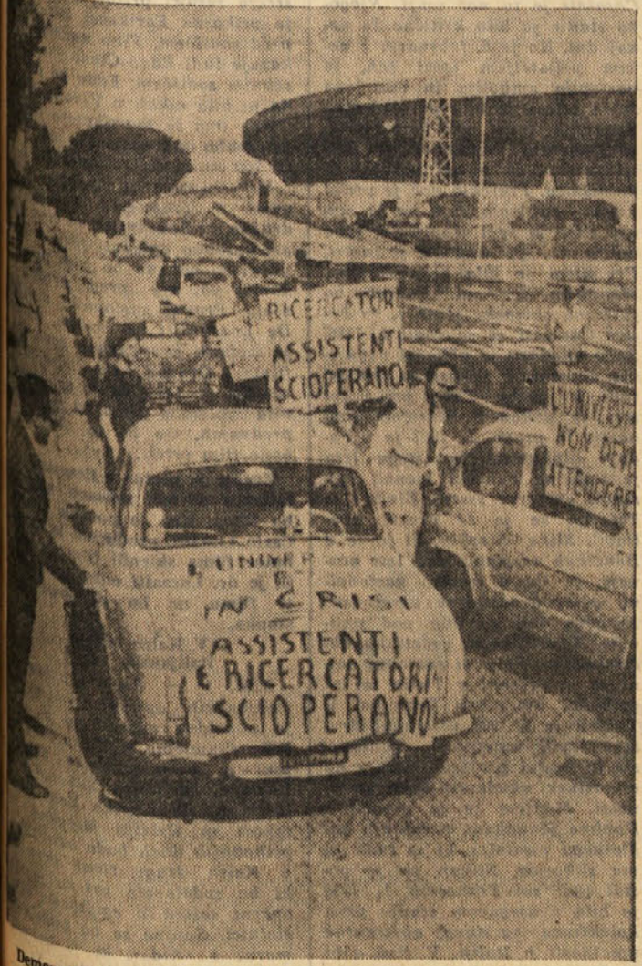
Demonstracije stavkajočih univerzitetnih asistentov v Neaplju