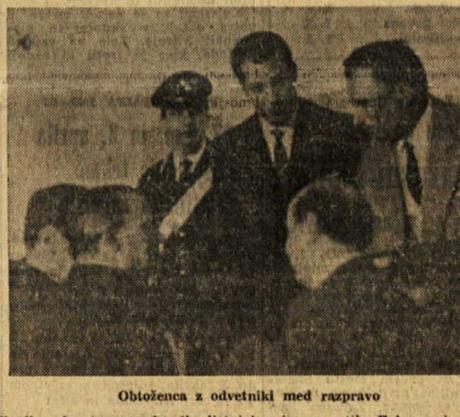
Obtožena z odvetniki med razpravo