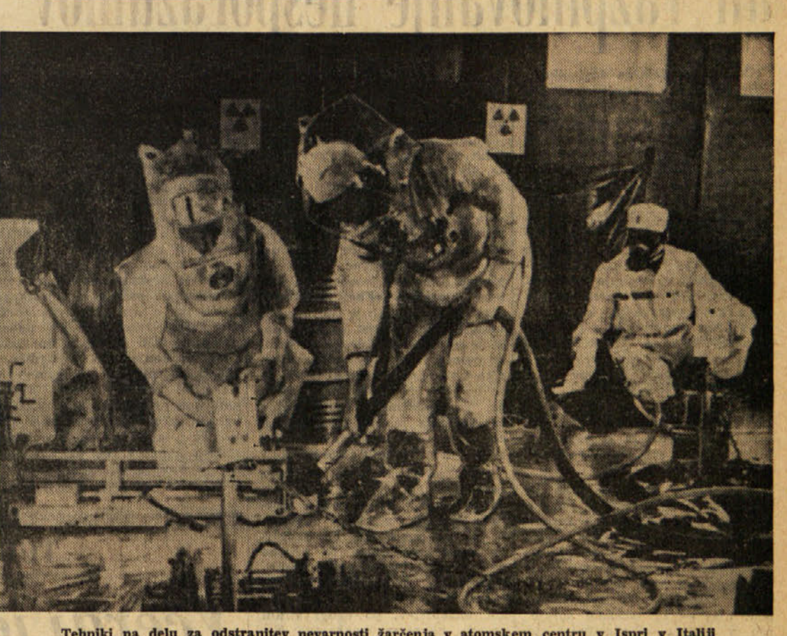
Tehniki na delu za odstranitev nevarnosti žarčenja v atomskem centru v Ispri v Italiji

Istočasno so odobrili tudi resolucijo, ki pravi, da Bundesrat z naklonjenostjo sprejema francosko-nemško pogodbo. Bundesrat poziva vladno, naj se zavzema, da bi z izvajanjem te pogodbe dosegli »velike smote, ki si jih je zvezna republika sporazumno s ostalimi zavezanjskimi državami zastavila, in ki so sestavni del nje politike«.