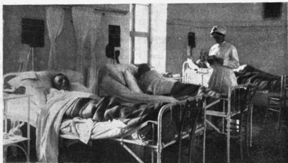
Karkoli ste tem storili, ste meni storili . . .

v zgodnjem jutru 21. majnika (1899) zapuščala samostan salezijank, je čula skrivnostni glas šepetati v svojem srcu: »Nič ne maraj in ostani pogumna; pozabi na vse in prepusti se brez pridržka Jezusu! Ljubi ga zelo, ne delaj nobenih ovir njegovim nameram, in boš videla, kako hitrih korakov boš napredovala, da še sama ne boš tega zapazila. Le nič se ne boj; ker Srce Jezusovo je prestol usmiljenja, kjer so ubožci najbolj sprejeti.« Nato Gema vsa potolažena: »O moj Jezus, prav rada bi te zelo, zelo ljubila, pa ne znam.« In tajni glas ji ponovi, kar ji je že drugekrat naročal: »Hočeš torej vedno ljubiti Jezusa? Ne nehaj niti za hip trpeti zanj! Trpljenje je prestol pravih ljubiteljev, križ pa bogastvo izvoljenih na zemlji.« Koliko nebeške modrosti je v teh besedah! Gotovo niso veljale samo Gemi,