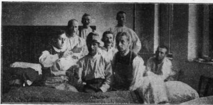
Bogoslovci strežejo nanjencem.

Pa se že kako prerinem; z ono malo denarja, kar sem ga tam prihranil, si kupu-