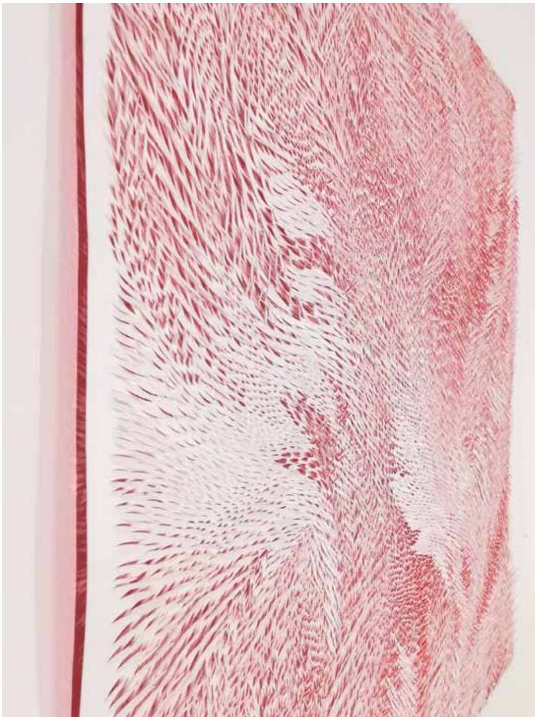
3. Navzven, detajl, 2022, rezljan papir, akril, 72,5 × 72,5 × 1 cm