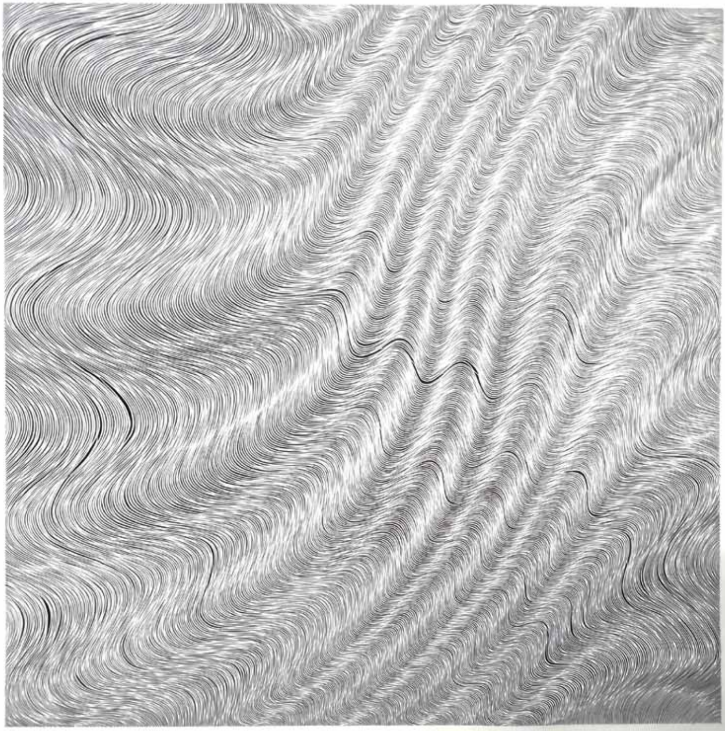
4. Valovanje, 2022, rezljan papir, akril, 123 × 123 cm