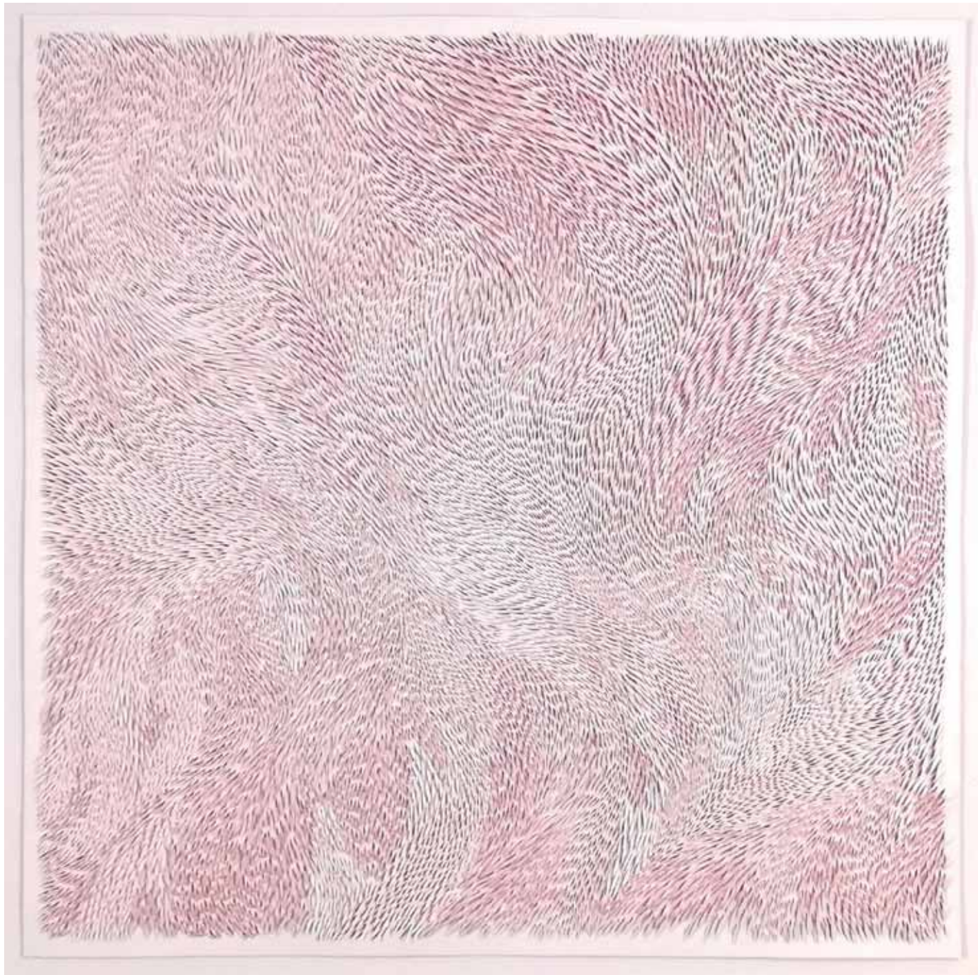
2. Navzven, 2022, rezljan papir, akril, 72,5 × 72,5 × 1 cm