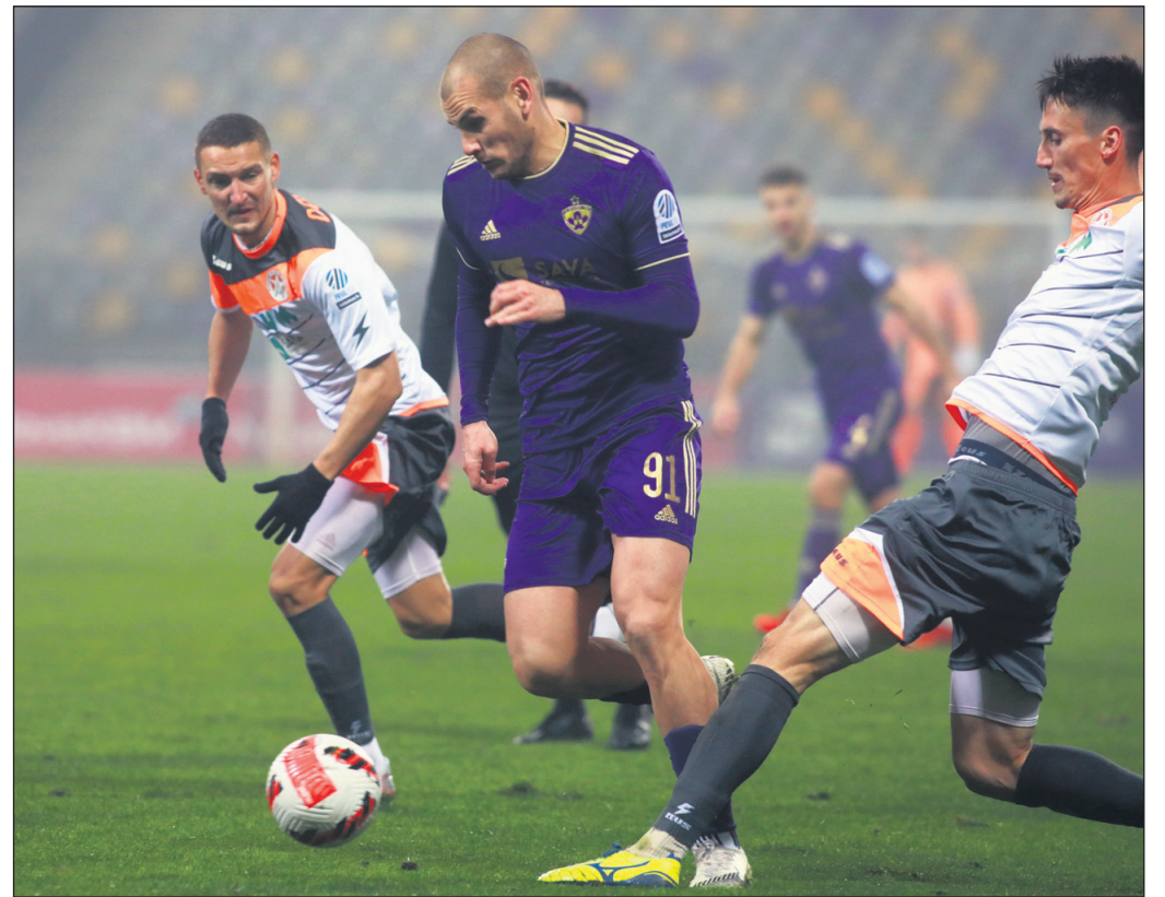
Nogometaši Maribora so znali izkoristiti napake Kidričanov, ki jih ni bilo malo ...

»Če bi v 42. minuti odigrali enostavno, bi se žoga znašla 80 metrov od našega gola in bi se polčas verjetno končal 0:0. V slačilnici bi se po-