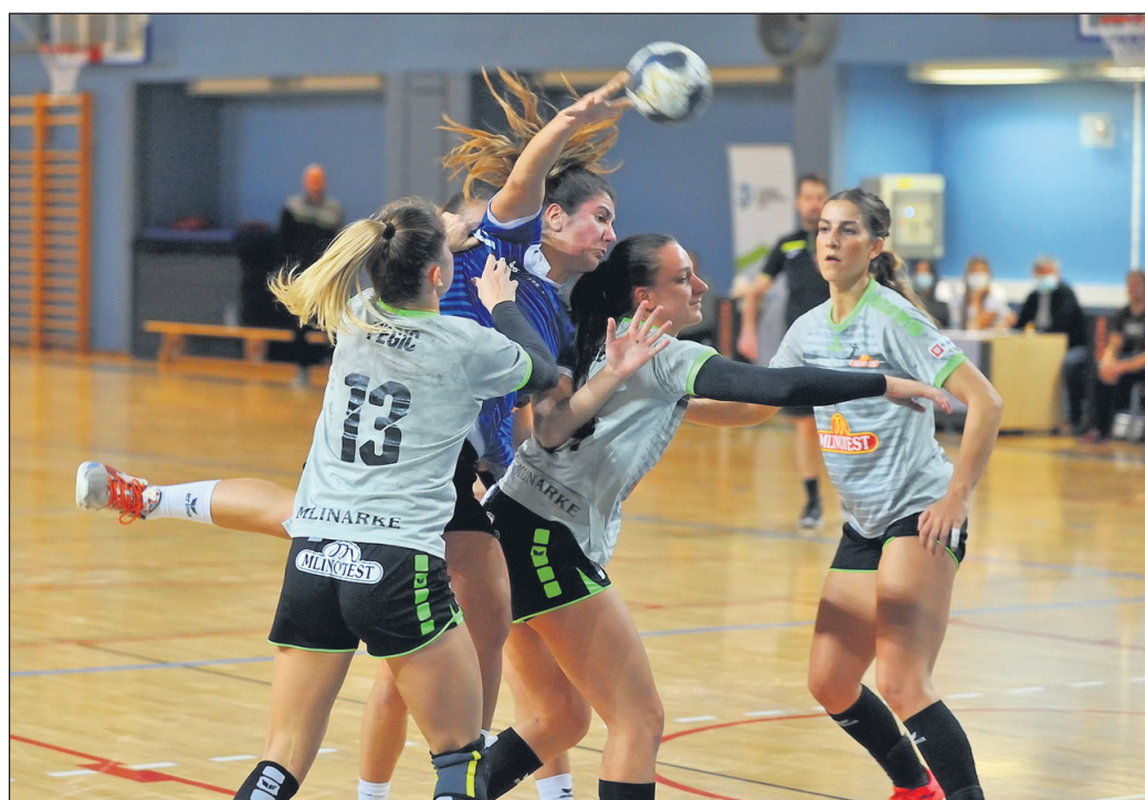
Igralke iz Ajdovščine (v svetlih dresih) so tudi v drugem medsebojnem srečanju v sezoni zmagale s ptujsko ekipo, a je šlo v drugo z veliko manjšo prednostjo.