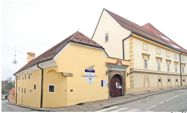
En del knjižnične stavbe že ima novo fasado.

Knjižnica Ivana Potrča na Ptuj, ki velja za eno najlepših slovenskih knjižnic, dobiva še lepšo zunanjo podobo.