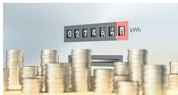
Fotografija je simbolična.

Delno naj bi dobili povrnjen izgubljen dohodek samozaposleni,