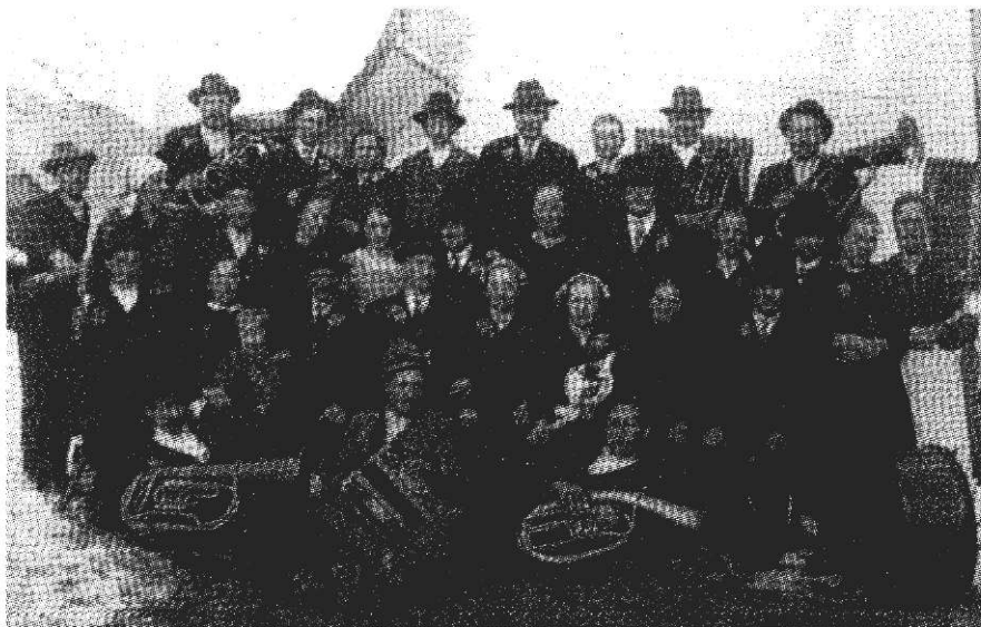
Ohcet pri Rezarju na Ljubnem okoli leta 1925

Ko je ohceti konec, je »rajtnga«: vsak izmed svatov plača enak delež, le camar in oba družca plačata goldinar več. Prej še sledi barantanje starešin s camarjem za vino, nato pa pobiranje denarja. Tudi tu poznajo ponovitev »male« ohceti čez sedem dni, le da ne rečejo temu »jesih«, ampak »umivalca«. Na to jih povabi camar, ki mora tudi tokrat skrbeti za dobro vzdušje.