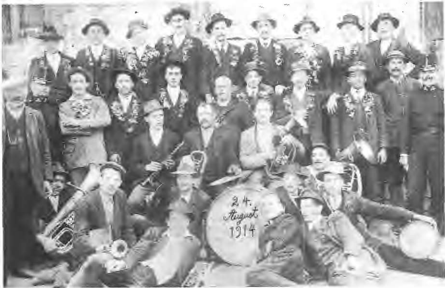
Godci med vpoklicanimi na prvo svetovno vojno v Gornjem gradu

stov, družinskih, vaških in drugih slavij. Tudi na raznih romanjih so godci pomenili veliko sprostitiv. Vedeti je treba, da so nekoč ljudje romali tudi v oddaljene kraje in je tako popotovanje trajalo po več dni ali celo tednov. Sicer pa ni bilo narodne prireditve v času čitalniškega življenja, kjer ne bi prišli do veljave godci, čeprav so v središčih že uvajali razne godalne skupine, ki so tedaj veljale za nekaj več od domačih godcev. Lahko bi rekli, da so se naši ljudje znali povесeliti ob vsaki priložnosti, tudi ob takih, ko je marsikomu šlo na jok, denimo ob odhodu vojaških obveznikov.