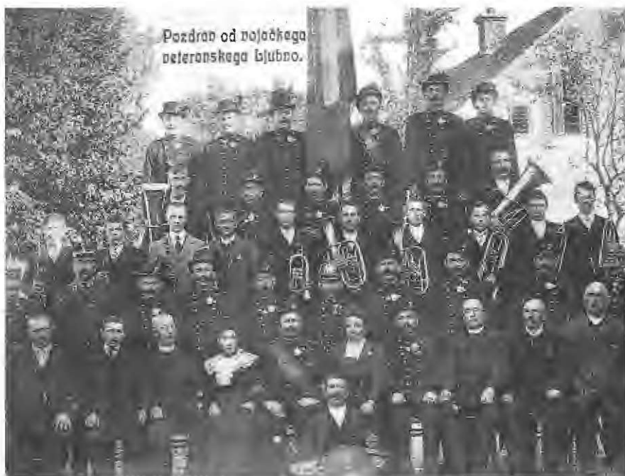
Ljubenski godci leta 1912 med vojaškimi veterani