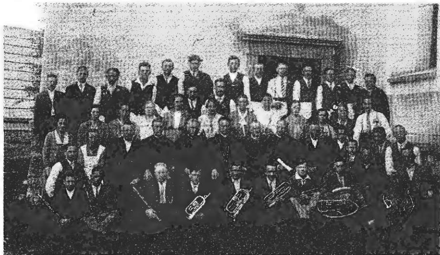
Šmihelska godba pri Sv. Križu nad Belimi vodami kmalu po prvi svetovni vojni, ko so »vlekli« v zvonik nove zvonove

Ura dvanajst je odbila, vse za večnost pridobila, kdaj umreti treba bo, pridi Marija z Jožefom.