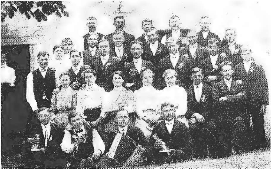
Lepa nedelja v Lepi njivi pred prvo svetovno vojno

Občevalni jezik godcev je bil zelo pester, včasih tudi duhovit. Seveda se tu pojavljajo skovanke, pa vendar, tudi te je treba ohraniti, ko gre za spomin na domače godce. Tako so rekli »Če je vižen, bo že godek«. Beseda »vižen« je tu uporabljena kot da ima nekdo posluh za glasbo. Ponekod opazimo tudi izraz »vižov«, kar pomeni smiselno isto, le uporaba besede je vezana na drug kraj (predel). Godci so igrali največ »iz fraj glave«, 13 kar pomeni – na pamet. Če so katero na novo pogruntali, so rekli »V družbi so prinesli kako vižo nanovo«. Če je kdo bil pozabljen, so rekli da je »pozabeten«.