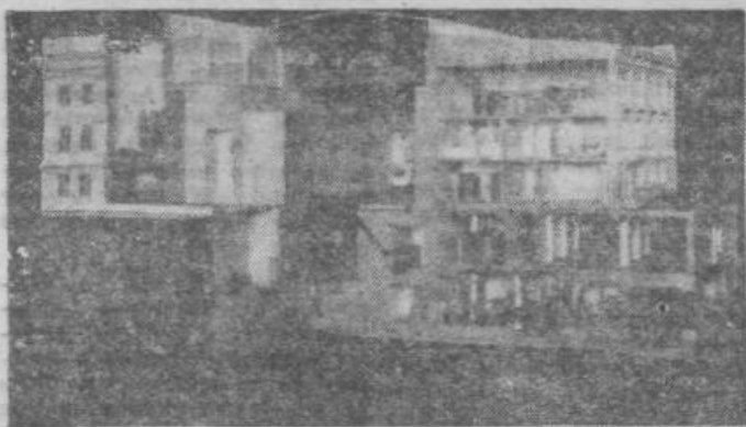
Model atomske centrale

Zgled okraja Nova Gradiška kaže, koliko je še neizkoriščenih možnosti za povečanje kmetijske proizvodnje, za katere bi bila potrebna le majhna sredstva, da bi dosegli dobre rezultate in to zelo naglo. Ta zgled prav tako kaže, da se postavlja potreba, da bi skupnost z uredbo zavežala pridelovalce in kmetijsko organizacije za izkoriščanje kmetijskih površin ne glede na lastnina.