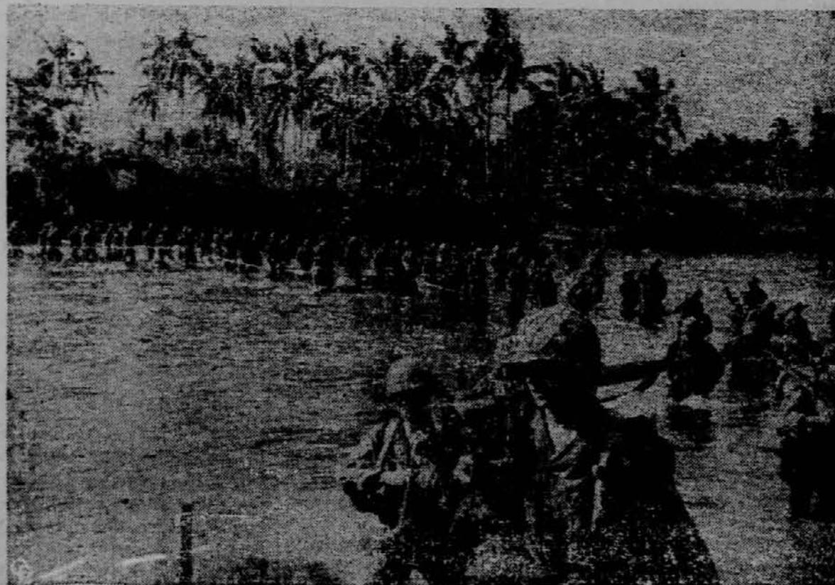
Vrv, napeljana z enega brega reke na drugega, je ameriškim vojakom kažipot čez reko na filipinskem otoku Leyte.