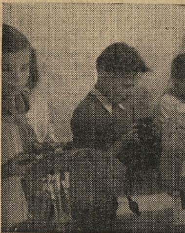
Tudi najmlajše pridno uvajajo v umetnost čipkarstva — Pionirji iz vasi Trebija v Poljanski dolini

čih in inozemskih razstavah ter velesejnih, kjer okusni in pestri izdelki dostojno predstavljajo vrednost in visoko kakovost slovenske domače in umetne obrti, ki si v vedno večji meri utira pot na inozemska tržišča.