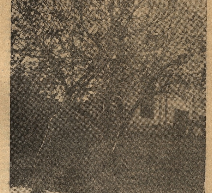
Okoliški hribi so še pokriti s snegom, burja in dež početa popustiti soncu. Vendar so se v nekaj lepih dnevih, ki smo jih pravkar imeli, bobnotno razcveli mandeljani, silve in breskve ter številno ostalo drevje napenja pople, ki se je tu pa tam razpo — prva pomlad je tu

Vse to nam dovolj zgovorno dokazuje, kako naši delovni razumejo pomen zgodovinskega dne, ko bodo sprejeli v upravljanje gospodarska podjetja, na kar se z vso odločnostjo pripravljajo s postrivitvijo borbe za izgradnjo socializma v našem okrožju.