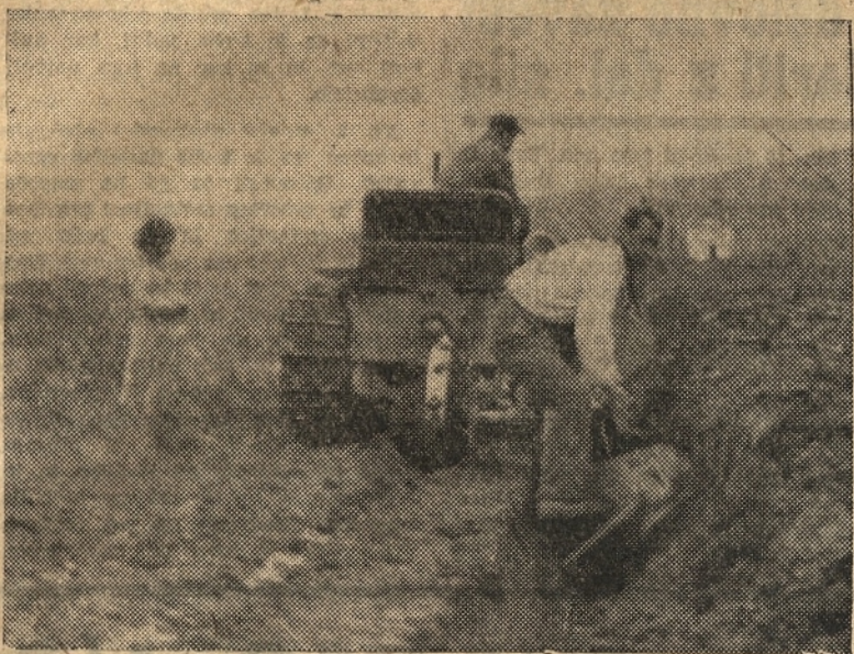
Za pomladansko setev moramo mobilizirati vse razpoložljive delovne sile, traktorje in živino moramo racionalno izkoristiti

Upamo, da bo zavladal pri vladah Vzhoda in Zapada zdrav razum, in da bodo resno pristopili k zeleni mizi in rešili svetovna vprašanja tako, kakor si želijo miroljubne države in narodi v svetu.