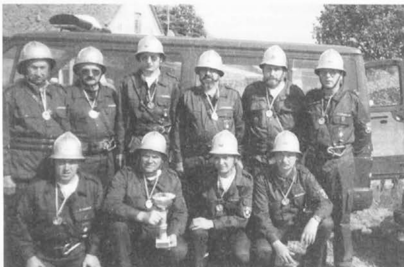
P. G. D. Ravne na Koroškem

Ob ogromnem trudu, ki smo ga ravnski prostovoljni gasilci vložili v priprave na tekmovanje, ste k našemu dobremu rezultatu mnogo prispevali tudi vsi, ki ste prislunili raznim potrebam desetine. Zahvaljujemo se vsem, ki ste nam kakorkoli pomagali.