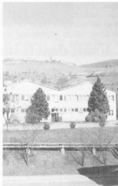
Proizvodna hala Nožev

Ob pripravi gospodarskega načrta za letos so v Nožih definirali tudi ukrepe za izboljšanje poslovanja. Med kratkoročne so uvrstili: revizijo pogodb z dobavitelji, zmanjšanje zaloga, zmanjšanje režije s premestitvami na proizvodna delovna mesta, načrtovanje in spremljanje stroškov po organizacijskih enotah, zmanjšanje specifičnih porab, boljšo organizacijo dela, skrajšanje pretočnih časov, zmanjšanje stroškov delovne sile s povečanjem proizvodnje, uskladitev plač s produktivnostjo. Dolgoročni