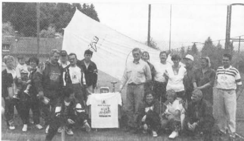
Udeleženci 5. teniškega turnirja na Rimskem Vrelcu