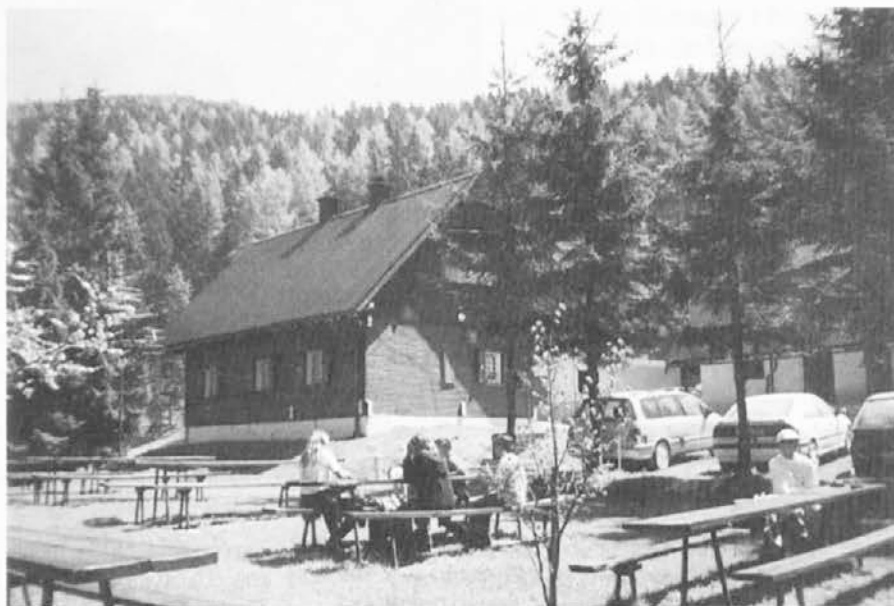
Koča PD Ravne na Naravskih ledinah je planincem prijazna.

Ravenski planinci so s ponosom ugotovili, da je varnost na njihovih izletih in gorskih turah dobra in niso imeli nesreč, ki so v večini primerov posledica precejevanja samega sebe in podcejevanja narave, ki je v svoji lepoti lahko tudi kruta.