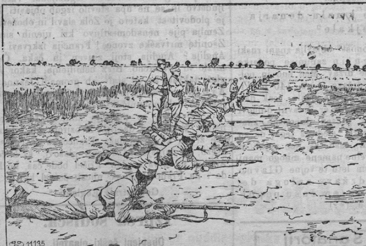
Österreichische Infanterie in Schwarmlinie.