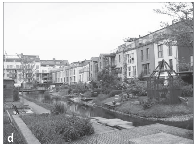
Slika 4: Odprti javni prostori v trajnostni soseski Western Harbour: (a) vodni kanal, (b) javna promenada »Sundspromenaden«, (c) park za skejtanje, (d) park

soseskama ni uspelo doseči (ali ohraniti) heterogene družbene strukture. Poleg tega obstaja realna možnost, da bi lahko trajnostni soseski postali »ekskluzivni citadeli« (Fainstein, 2010). Soseski Vauban je še posebej v prvih letih uspelo zagotoviti precejšen delež cenovno dostopnih stanovanj (Fraker, 2013). V zadnjem času pa so se najemnine zelo povišale. Stanovanja so zdaj med najdražjimi v mestu Freiburg, zato je večina prebivalcev izobraženih strokovnjakov (Bächtold, 2013:81). Tudi Sigrig Gombert (2013) in Carsten Sperling (2008) ugotavljata spremembo družbene strukture (od prvotnih skupin aktivistov do mladih družin iz višjega srednjega razreda), vendar se je prvotna urbana družbena struktura delno ohranila (»socialna stanovanja« SUSI, Haus 037 itd.). Tudi soseska Western Harbour je bila prvotno mišljena kot heterogeno in socialno vzdržno urbano območje (Kärholm, 2011), zdaj pa v njej pretežno prebiva zgornji srednji razred. Prvi trajnostni urbani del (Bo01) je bil očitno namenjen družinam z višjimi dohodki (Madureira, 2015).