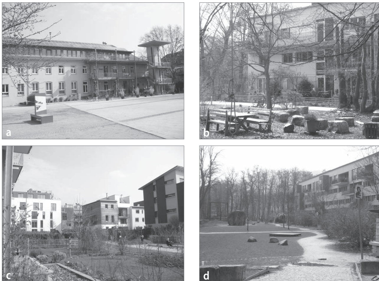
Slika 2: Odprti javni prostori trajnostne soseske Vauban: (a) Haus 037 in trg Alfred-Döblin Platz, (b) park, (c) urbani vrt, (d) park

močje se je razvilo v sodobno sosesko z velikimi trajnostnimi ambicijami. Soseska Western Harbour je bil zgrajena postopoma, v treh fazah: Bo01, Flagghusen-Bo02, Fullriggaren-Bo03. Nova trajnostna bivalna območja se še vedno gradijo. Trenutno ima soseska 4.300 prebivalcev. V njej je zaposlenih kar 9.000 oseb (Foletta, 2011). Število delovnih mest na prebivalca je zelo visoko, če ga primerjamo s podobnimi trajnostnimi soseskami v Evropi. Ko bo soseska končana, bo v njej delalo in študiralo 30.000 oseb. Western Harbour postaja novo študentsko in gospodarsko središče mesta Malmö.