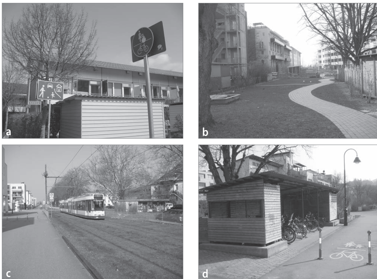
Slika 1: Trajnostni promet in ceste brez avtomobilov v trajnostni soseski Vauban: (a) ceste kot igrišča, (b) ceste brez avtomobilov, (c) tramvaj, (d) kolesarnica

prilagojene pešcem in kolesarjem (sliki 1a in 1d). Prometna ureditev spodbuja souporabo avtomobilov. Zaradi teh ukrepov, zakonov, lokalne politike in osveščenosti domačinov glede varovanja okolja ima malo ljudi lastno vozilo. Na 1.000 prebivalcev je le 150 lastnikov avtomobilov. V občini Freiburg je na 1.000 prebivalcev 427 lastnikov avtomobilov – nemško povprečje je 517 (Sperling, 2008; The World Bank, 2013).