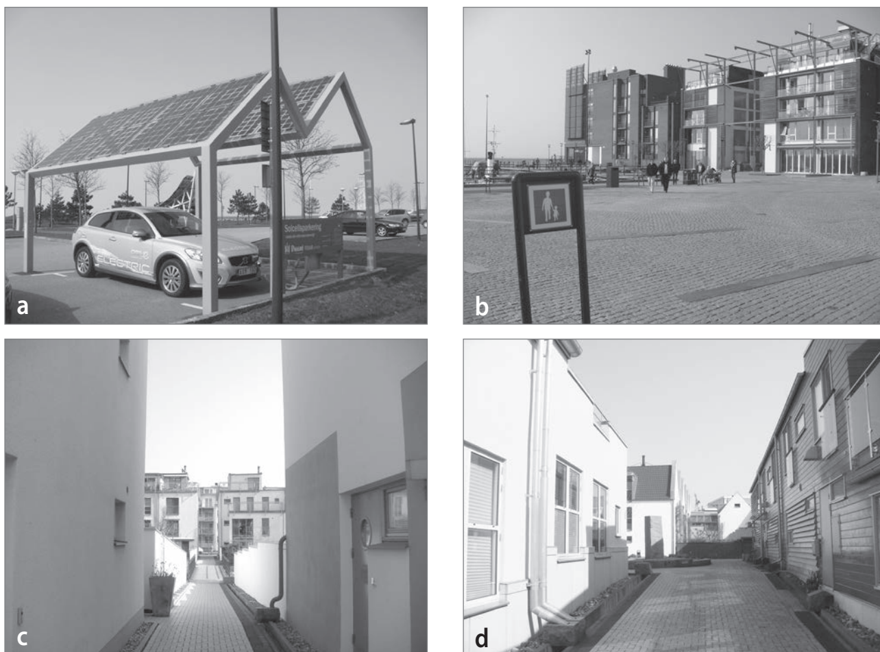
Slika 3: Trajnostni promet in ceste brez avtomobilov v trajnostni soseski Western Harbour: (a) električni avtomobil v okviru storitve souporaba avtomobila, (b) javni prostor brez avtomobilov, (c) in (d) ulice brez avtomobilov

2014). Vendar so zaradi pritiska lokalnih prebivalcev spremenili parkirno politiko in povišali število parkirnih mest (1,5 parkirnega mesta/stanovanje). Prebivalci soseske lahko uporabijo storitev souporaba avtomobila (slika 3a), ki je v soseski postala zelo razširjena (Johansson, 2014; Löf, 2014). Pri razvoju soseske Fullriggaren-Bo03 pa je bilo članstvo v shemo souporabe avtomobilov vključeno v najemnino za prvi dve leti. Zadnje leto je v soseski Western Harbour postala razširjena celo souporaba koles.