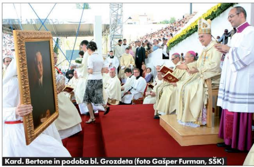
Kard. Bertone in podoba bl. Grozdeta

služabnika Alojza Grozdeta za prvega slovenskega blaženega mučenca. Takoj po kesanju na začetku maše ga je s posebnim obredom razglasil državni tajnik Svetega sedeža, kardinal Tarcisio Bertone, ki je tudi vo-