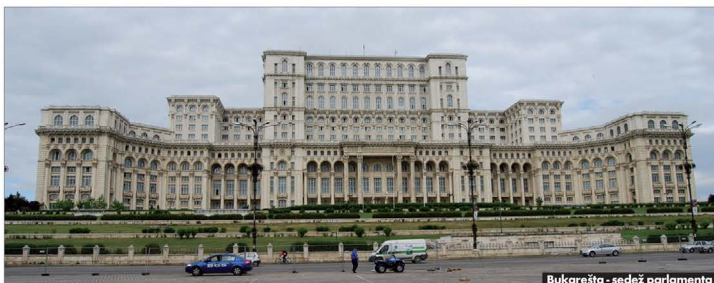
Bukarešta - sedež parlamenta