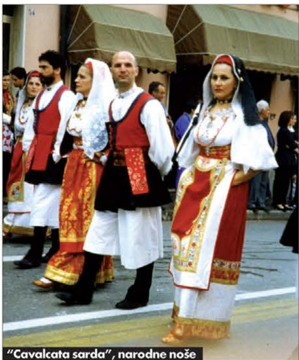
"Cavalcata sarda", narodne noše