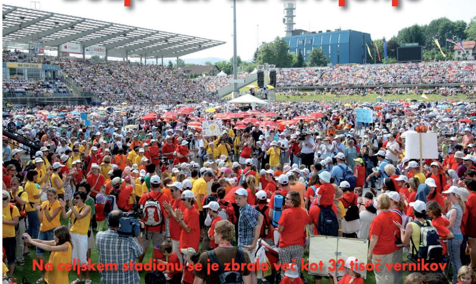
Na celjskem stadionu se je zbralo več kot 32 tisoč vernikov