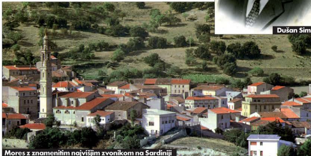
Mores z znamenitim najvišjim zvonikom na Sardiniji

sprožila ustrežajoče pogovore. Toda nam se je mudilo v Nuoro, kjer je bil napovedan prvi koncert slovenskih pevcev s kontinenta.