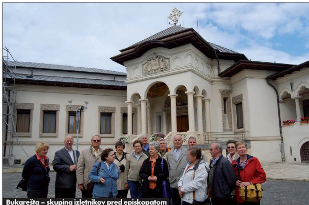
Bukarešta – skupina izletnikov pred episkopatom

Naslednji dan smo začeli pravo potovanje proti severu Romunije v Bukovino do nekdanje moldavske prestolnice