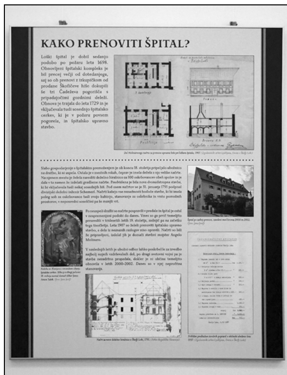
Eden od razstavnih panojev je skušal odgovoriti na vprašanje: Kako prenoviti špital?.

Razstava nam na desetih panojih razkriva zgodbo mestne ubožnice in skrbi za revne od srede 16. stoletja dalje. Avtorici sta jih podnaslovili z naslednjimi naslovi: Nastanek in upravljanje špitala, Financiranje ubožnice, Špitalska posest, Kako prenoviti špital, Mestni ubožci, Ubožnico prevzamejo redovnice, Oskrba ubožcev in Življenje v ubožnici. Vsak pano je vsebinsko zaključena enota, vsi skupaj pa tvorijo celotno zgodbo. Besedilo dopolnjujejo posnetki dokumentov, ki jih hrani Enota Zgodovinskega arhiva v Škofji Loki, ter fotografije iz fototeke arhiva, Župnijskega arhiva Škofja Loka in Loškega muzeja. Dodane so tudi fotografije sedanjega stanja špitalske stavbe, da sta avtorici zgodbo lažje postavili v prostor in čas. Poleg dokumentov, ki jih hrani škofjeloška enota arhiva, so bili predstavljeni tudi posamezni dokumenti iz Arhiva Republike Slovenije, tako da je zgodba in usoda ubožnice pred nami zaživela preko različnih dokumentov in fotografij.