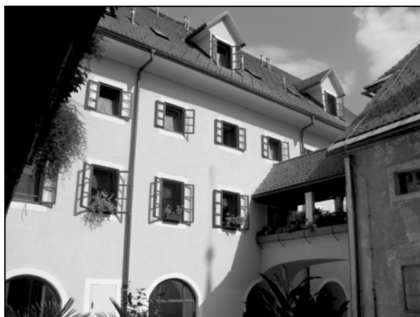
Notranje pročelje špitalske stavbe po zadnji prenovi, izvedeni med letoma 2000 in 2002.

Razmere, v katerih so živeli najrevnejši prebivalci mesta, so bile seveda odvisne predvsem od finančne podpore meščanov, ki so s svojimi volili, zapuščinami ali finančnimi prispevki vzdrževali mestno ubožnico vse do prve svetovne vojne, ko je del skrbi za svoje najrevnejše občane prevzela občina. Konec 18. stoletja, v času Jožefa II., je pomanjkanje sredstev vodilo v razmišljanje o prevzemu ubožnice v deželne roke. V Arhivu Republike Slovenije hranijo načrte za predvideno deželno hiralnico za sto oskrbovancev, ki jih je podpisal divizijski deželni inženir Schemerl 31. januarja 1791. Obsežna hiralnica s svojo kuhinjo in vrtom pa nikoli ni bila realizirana, tako je špital ostal v mestni lasti vse do 19. stoletja.