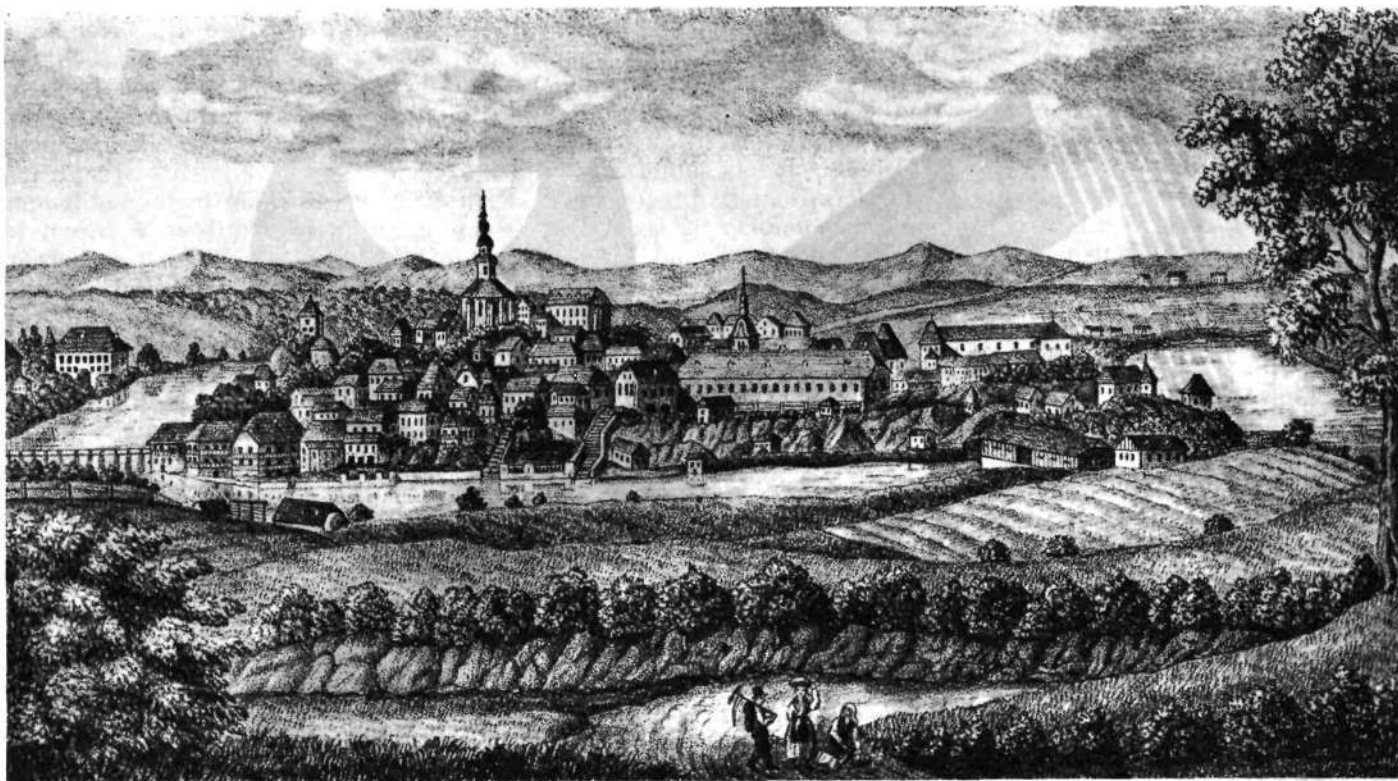
Novo mesto pred 100 leti

vilegije in še celo svojo podobo v mestni grb; cesar Friderik IV. je ustanovil 1493. novomeški kolegijatni kapitelj, cesar Maksimilijan je izposloval pri papežu Aleksandru VI. dovoljenje za zgradbo te kolegijatne cerkve; cesarica Marija Terezija je podelila 1774 kapillju cesarske insignije, proštu pa infulo; cesar Jožef II. pa je izpremenil z vladno naredbo s 1. sept. 1783 ime Rudolfswerth v Neustadtl (Novo mesto).