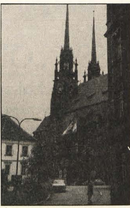
BRNO - Peter-Pavlova cerkev

Reka Svitava nas je spremljala proti jugu do izliva v Dyjo proti mestu Vreclovu, mimo znanih Mikulčic, kjer smo hoteli videti obširne izkopanine središčnega mesta stare Moravske ob reki Moravi.