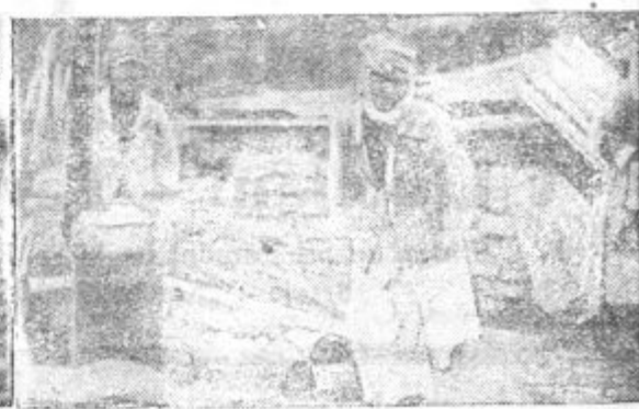
Opustošenje po strahotnem potresu v Turčiji (z leve na desno): Eua izmed mnogih žrtev — Zasilno zaklonišče za begunce — Ob pečici na prostem se grejejo