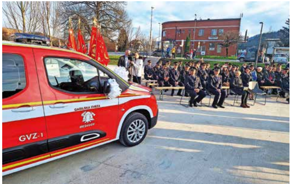
Osnovno vozilo je Citroënov model Berlingo 1,5 HDI s povečano nosilnostjo in z nadgradnjo.

Občina Medvode je na spletni strani objavila Javni razpis za sofinanciranje obnove zunanega ovoja stavb mestnega jedra Medvod v letu 2023. Predmet razpisa je sofinanciranje obnove fasad, streh, zunanjih vrat in oken stavb, ki stojijo na območju mestnega jedra, in sicer na naslovih Cesta komandanta Staneta 6 in od 8 do 39 ter Seškova cesta v celoti od 1 do 30. Rok za prijavo se izteče 31. maja. Višina razpoložljivih sredstev je 25 tisoč evrov. Namen javnega razpisa je spodbujanje obnove zunanega ovoja stavb mestnega jedra Medvod s ciljem urejenega zunanega videza posameznih stavb in naselja. M. B.