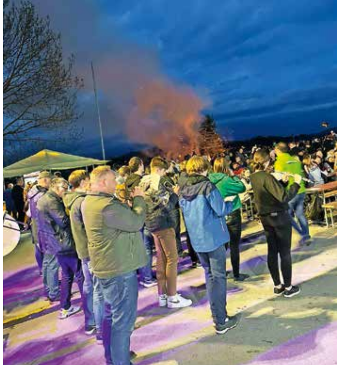
Godbeniki so popestrili tudi Kresovanje v Goričanah.