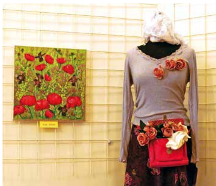
Pirniške likovnike je tokrat navdihnila pomlad.

Razstavo si je med 13. majem in 17. junijem možno ogledati vsako soboto od 14. do 15. ure ali po predhodnem dogovoru z Majdo Žakelj (031 241 850) vse do 21. junija. Likovniki KUD