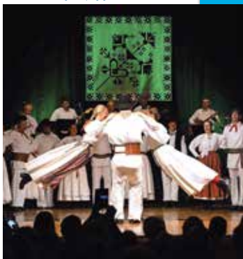
Petdeset let folklorne sekcije KUD Oton Župančič Sora