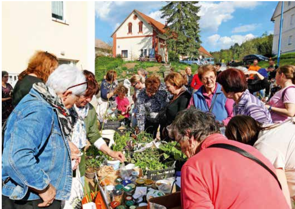
Flancanje je bilo letos nekoliko prej kot običajno. Obiskovalci so kljub temu lahko izmenjali različne vrste sadik in semen.

Flancanje je bilo znova dobro obiskano in tudi ponudba različnih sadik in semen za izmenjavo je bila pestra. »Prinesla sem aloje, paradižnik, dalije ...,