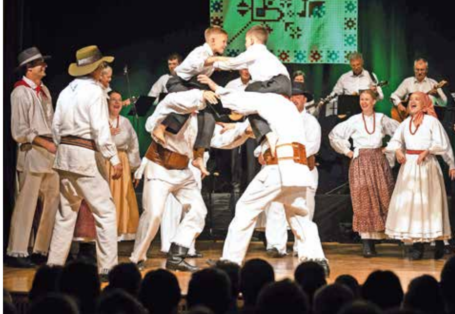
Ta prcajtani so v venec belokranjskih plesov vpletli tudi boj očetov s sinovi na ramenih.

Naslov koncerta je bil Maj in obiskovalci so oba večera do konca napolnili dvorano Kulturnega doma v Sori. Sorški folkloristi so že dolgo znani po odličnem delu z otroki in mladimi, tokrat pa so po dolgem času na oder spet stopile tudi starejše skupine. S plesom so povezali stara ročna opravila od teritve lanu in izdelovanja preje, ribolova in pranja do čevljarstva, priprave drv in vinogradništva. Na skoraj dve uri dolgem koncertu so nastopili Mlajša in Starejša otroška folklorna skupina, Mladinska folklorna skupina, pevska skupina Polončice, Ta prcajtani, Ta poženeni in Veterani. Na odru so jih spremljali domači glasbeniki pod vodstvom Alje Šlenc, le za venček belokranjskih je na glasbeni oder stopila Tamburaška skupina Bisernica iz sosednjih Reteč, ki jo vodi Janez Kermelj.