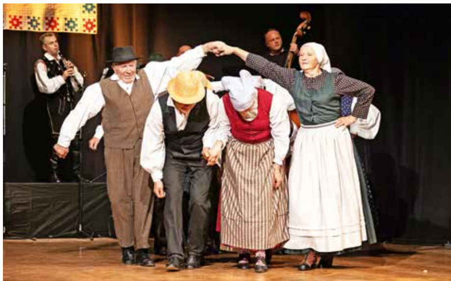
Današnji veterani so bili leta 1978 prva sorška mladinska folklorna skupina.