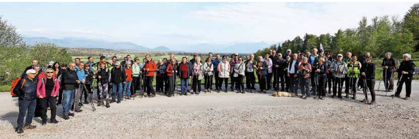
Na Pohod po poteh spominov in prijateljstva se je podalo veliko pohodnikov. / Foto: Iztok Pipan

so tudi tokrat obiskali spominska obeležja in se poklonili padlim borcem. V dobrih treh urah so prehodili okrog deset kilometrov. Vreme jim je bilo tokrat naklonjeno in zato je bila tudi udeležba dobra.