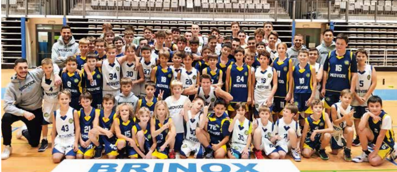
V klubu imajo tudi veliko mladih košarkarjev.