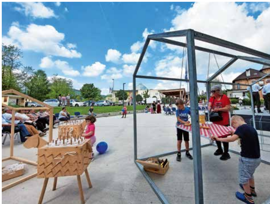
Medvoški kulturni festival bo tudi letos popestril dogajanje s številnimi dogodki.

Festival bo trajal osem dni, najbolj zanimivo in pestro pa bo dogajanje v soboto, 20. maja, ko bodo obiskovalci v dopoldanskem času na Tržnici Medvode lahko z roparskimi vitezi spili čaj pri Marješki Pehti, spoznali varuhe naše dediščine pod okriljem Občinske