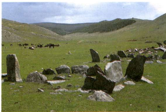
Slika 2: Enolična stepa se razprostira po širnih planjavah in prisojnih pobočjih. Bolj proti severu države na osojnih legah vedno pogosteje naletimo na zaplate iglastega gozda.