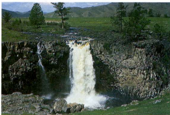
Slika 3: Slap na reki Orhon predstavlja prvovrstno turistično znamenitost. Na uravnanem površju srednje Mongolije so brzice in slapovi prava redkost.