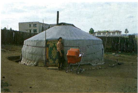
Slika 4: Jurta je še danes osnovno bivališče večine Mongolov. Tudi večina urbana prebivalstva živi v jurtah, ki jih v mestih postavijo kot stalna bivališča. Z lesenimi plotovi ločijo svoje zemljišče od sosedovega.

V zgodovinskem razvoju te države bi lahko ločili več pomembnih obdobij, ustavili pa bi se le pri dveh pomembnih zgodovinskih ločnicah v 20. stoletju. Prva je leto 1921, ko je Mongolija z revolucijo postala sovjetski satelit in je to ostala do velikanskih sprememb v SZ v preteklih letih. Z razpadom modela t. i. realnega socializma v SZ in vzhodnoevropskih državah je veter demokratizacije zapihal tudi po mongolskih stepah. Leta 1990 je Mongolija izvedla prve demokratične večstrankarske volitve v zgodovini in se