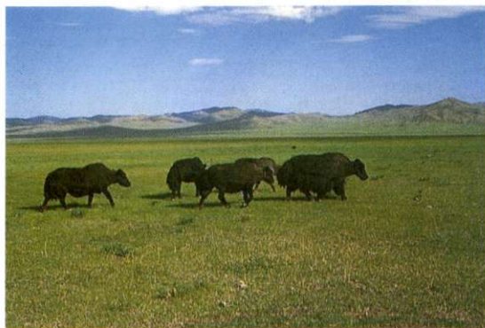
Slika 1: Neizmerna prostranstva stepe dajejo državi edinstven pečat. Med milijoni glav živine, ki se tu pasejo, so pogosti tudi jaki.