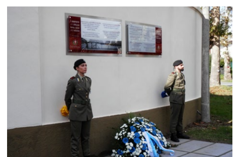
Obeležje s častno stražo