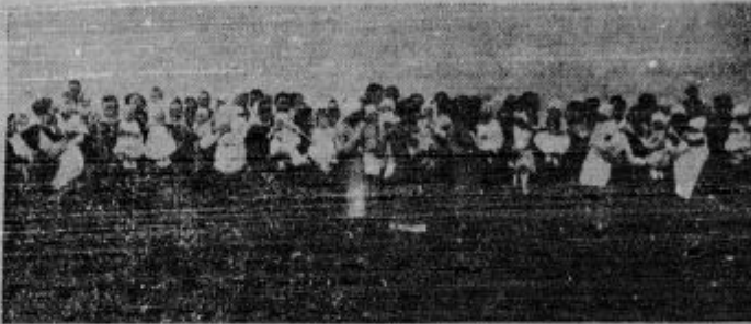
Vesela pomlad v Prečni pri Novem mestu.