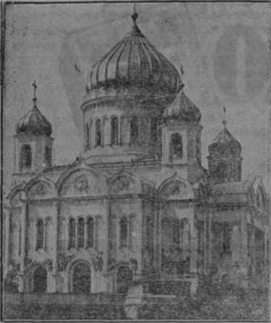
Zveličarjeva katedrala v Moskvi, katere so razstrelili boljševiki.

Najkrasnejše svetišče Moskve v razvalinah. Ena najlepših cerkvenih stavb na svetu, sveto carske Rusije, moskovska Zveličarjeva katedrala, je v razvalinah. Kakor smo že poročali, so jo pogrnali boljševiki dne 5. decembra s petimi dinamičnimi naboji v zrak. Sovjeti bodo zgradili na mestu katedrale kongresno poslopje. Eksplozija je pretresla celo Moskvo. Daleč naokrog je razmetal strahoviti razpok dele zidovja. Pobožni ljudje, katerih je še danes dovolj v Moskvi, so pobirali ostanke svetišča in jih shranili po hišah. V cerkev samo se že dolgo ni nikdo upal, ker jo je stražila tajna policija. Moskovsko Zveličarjevo katedralo so gradili 50 let in sicer od l. 1837 do 1887. Stavba je stala 20 milijonov rubljev, kar je bila ogromna svota za tedajne čase. Dograditev cerkve je bilo kronanje zopetne pozidave leta 1812 v napoleonskih vojnah porušene in z ognjem uničene Moskve. V cerkvi je bilo prostora za 7000 ljudi. Na veliko noč in na praznik blagoslovitve vode je gorelo v katedrali 4000 sveč. Petje je oskrboval zbor 200 dijakonov. Notranjost svetišča je bila razkošno okrašena z zlatom in marmorjem.