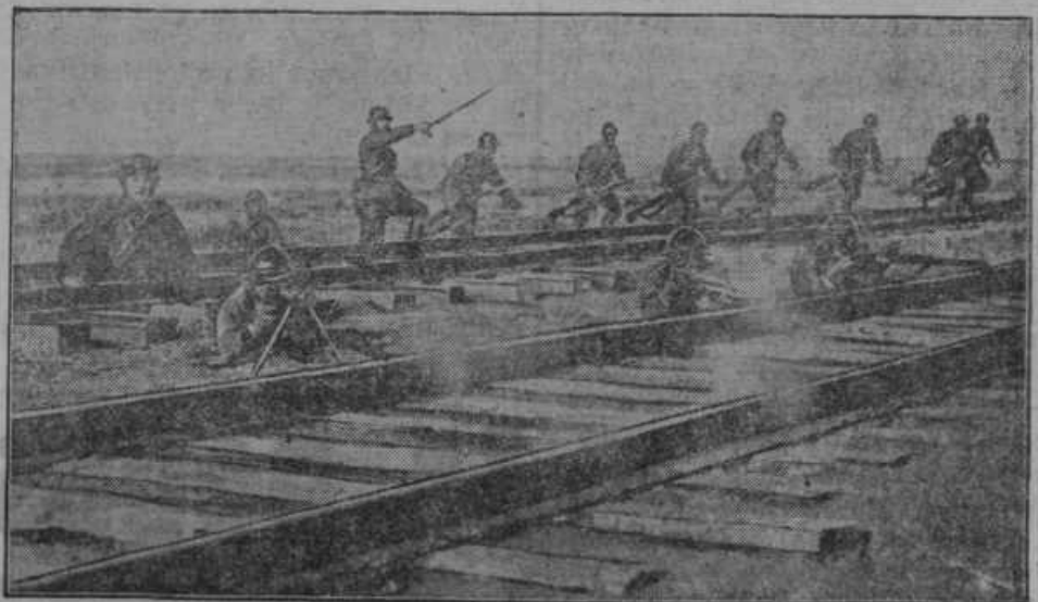
Bitka za most preko reke Nonni v Mandžuriji. Japonski oddelek s strojnico preide v napad.