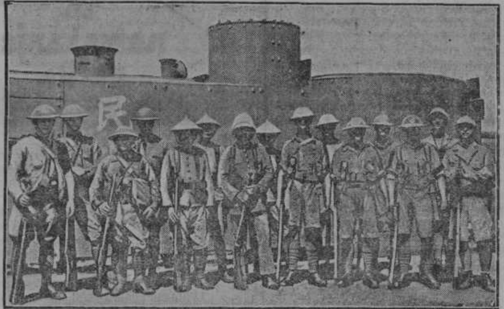
Mednarodna oborožena sila na Kitajskem. V oklopnem vlaku se je pripeljala v Tientsin na Kitajsko četa, v kateri so: ameriški, angleški, italijanski in japonski vojaki.

je izborno služil kot zaseda, da se tu skrivno zbirajo čete za nepričakovan napad sovražnika za hrbtom. Takih zased, katere so bile pripravljene vselej v gostih gozdovih in v stran od gozdnih potov, poznamo v ožji domovini več, kakor n. pr. »Na zasedi« ob Boču, »Poštela« na severnem obronku Pohorja, »Atilov grob« pri Radencih i.