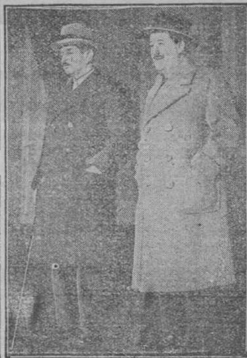
Francoska ministra: Laval in Cathal.

Naši naročniki iz Ptuja so pokazali dobro voljo ter skoro vsi poravnali naročnino v naprej, s čemur so nudili listu izdatno oporo. Uprava lista se vsem iskreno zahvaljuje predvsem posebnim dobrotnikom lista.