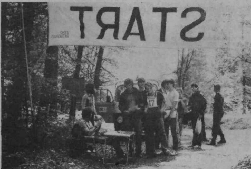
Start je bil v tako imenovani Sračji dolini, na začetku trimske steze. Petčlanske mešane ekipe so od tam hitro krenile proti kontrolni točki, kjer jih je čakala prva naloga, prva preizkušnja znanja (zgoraj). V primeru splošnega ljudskega odpora ali elementarnih nevarnosti mora praktično vsako obvladati osnove prve pomoči, zato so morali člani ekip praktično oskrbeti poškodovanca ter odgovoriti na nekaj teoretičnih vprašanj. Pri tem člani komisij niso bili samo izpraševalci, ampak so tekmovalcem tudi pojasnjevali napake in jim razlajali znanje. (spodaj levo)