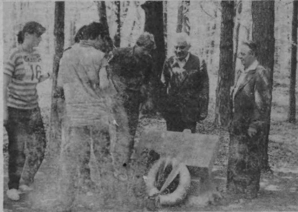
Sledil je prvi vzpon, katerega so se člani ekipe PTT izboraževalnega centra, ki smo jih spremljali na poti, sprva pogumno lotili, pa so kasneje le spoznali, da se tudi počasi daleč pride, zlasti v hrib. Na vrhu pa jih je čakala druga kontrolna točka, kjer so morali pokazati svoje poznavanje orientacije in topografije (zgoraj).