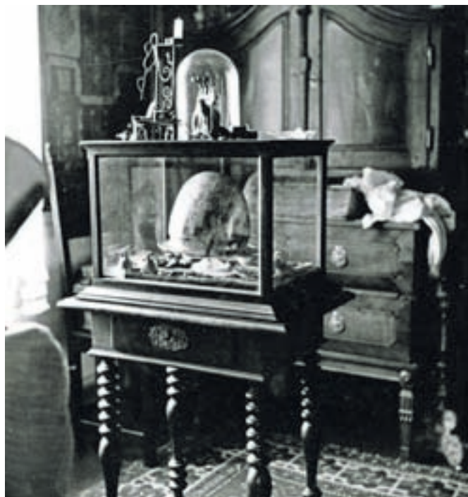
Vitrina z arheološkimi predmeti in čelado, ko je bila še v Sadnikarjevi zbirki

ga muzeja Kamnik, Narodnega muzeja Slovenije in Dolenjskega muzeja Novo mesto.