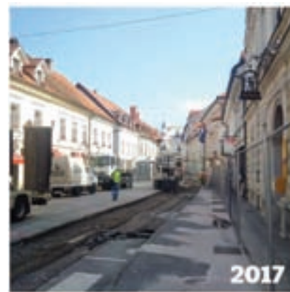
Začetek rekonstrukcije Glavnega trga leta 2017

enosmerni promet skozi mestno središče. S tem so se v zadnjem desetletju občutno izboljšali pogoji za kolesarje in pešce, mesto pa je postalo prijetnejše in prijaznejše za prebivalce.