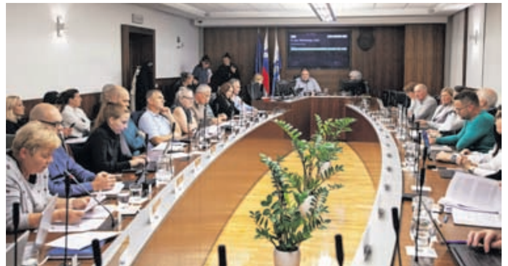
Svetniki so se konec oktobra sestali na šesti redni seji.

Kot je povedal Pogačar, trenutno poteka usklajevanje