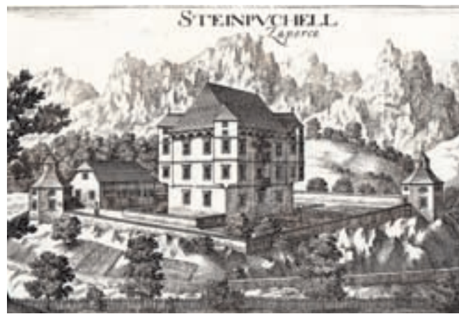
Graščina Zaprice, iz Valvasorjeve Slave vojvodine Kranjske, 1689