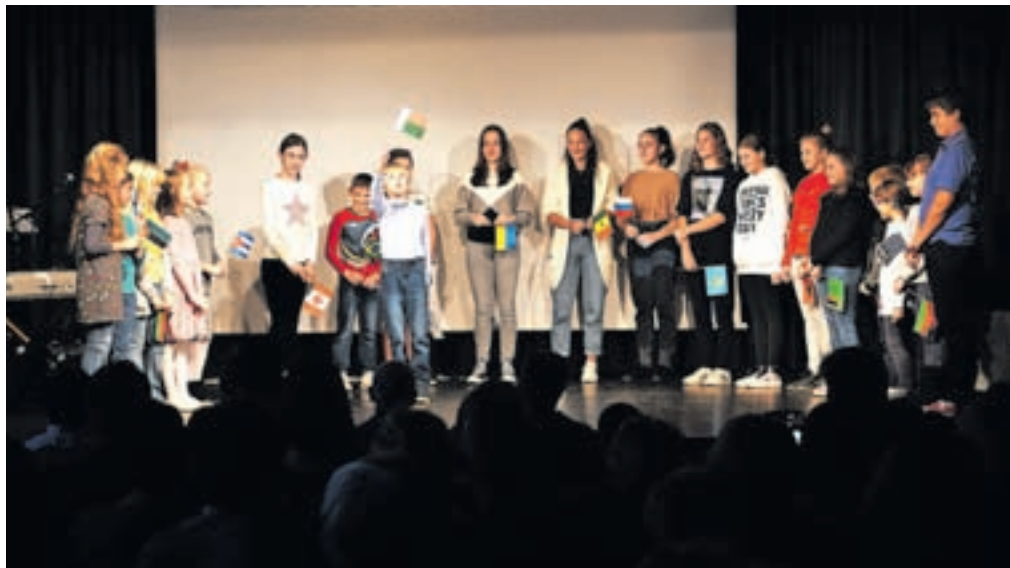
Otroci so navzoče nagovorili v jezikih držav, v katerih delujejo slovenski misijonarji.

Vsaka misija lahko postane »misija mogoče«, če le ljudje stopijo in delajo skupaj.