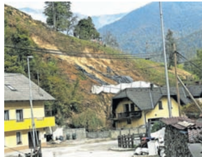
V občini potekajo sanacije plazov.

Kot še dodajajo na kamniški občinski upravi, pa tudi na plazovih, kjer so zaradi ugotavljanja geomehanske sestave tal potrebne raziskovalne vrtnice, že tečejo dela, saj v najkrajšem možnem času želijo zagotoviti, da bodo občani lahko varno živeli v svojih domovih.