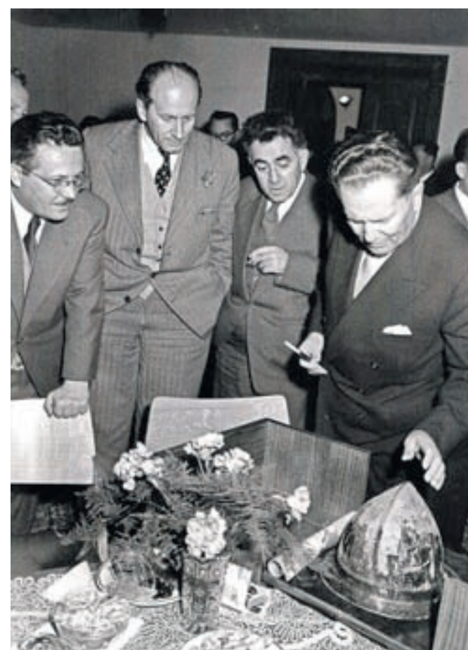
Tito si ogleduje čelado; Grm pri Novem mestu, 23. 11. 1958

Razstava z zgodbami treh čelad in drugimi arheološki-