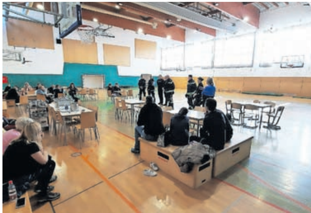
V telovadnico Osnovne šole Stranje so minuli petek evakuirali 114 oseb.