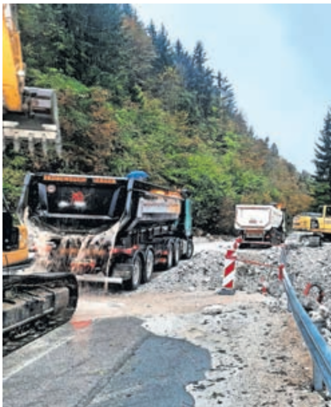
S pomočjo gradbene mehanizacije so ob petkovem neurju preprečili najhujše.