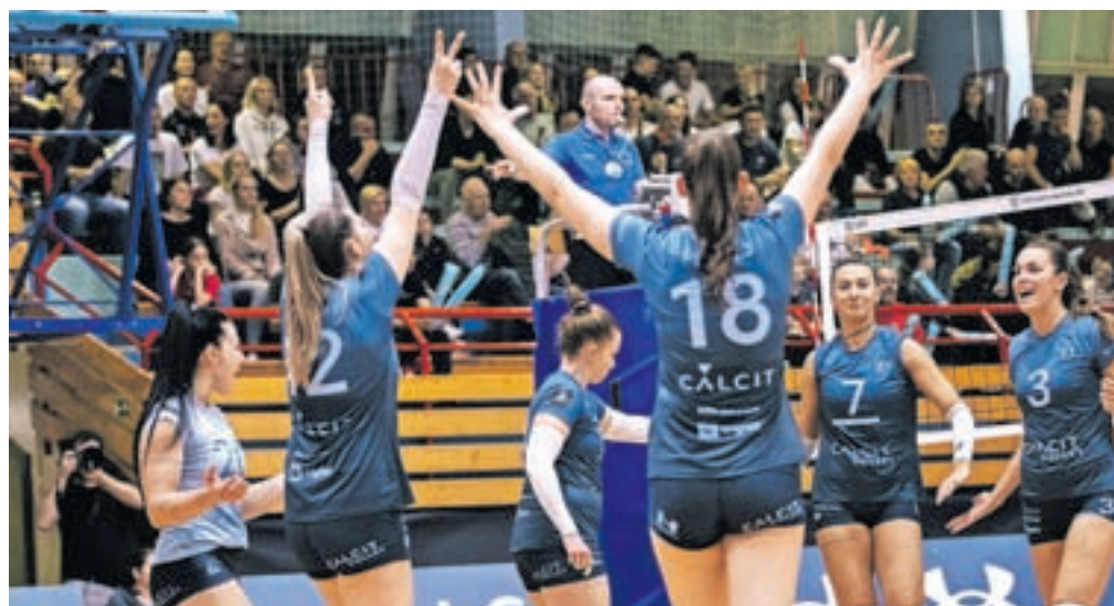
Odbojkarice Calcita Volleyja