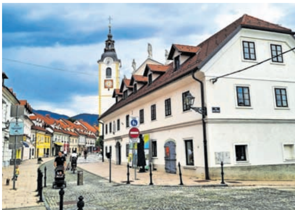
Obisk turistične destinacije Kamnik je bil v poletnem trimesečju letošnjega leta za dobrih 23 odstotkov manjši kot v enakem obdobju lani.

Tudi podatki za prvih osem mesecev nakazujejo na upad turistov. Kamnik je namreč v prvih osmih mesecih tega leta obiskalo 23.462 turistov (lani v istem obdobju 28.743), od tega 6177 domačih (lani 10.580) in 17.285 tujih turistov (lani 18.163). Po številu prihodov je bilo največ turistov iz Hrvaške, Nemčije, Češke, Italije, Francije, Nizozemske, Belgije, Madžarske, Avstrije, Poljske, Bolgarije in Izraela. Podatki kažejo, da je v prvih osmih mesecih pri kamniških namestitvenikih prenočilo skupaj 57.638 turistov (lani 72.234), od tega 13.607 domačih (lani 27.192) in 44.031 tujih turistov (lani 45.042). Na Kamniškem najpogosteje prespijo turisti iz Češke, Nemčije, Hrvaške, Italije, Nizozemske, Francije, Madžarske, Izraela, Bel-