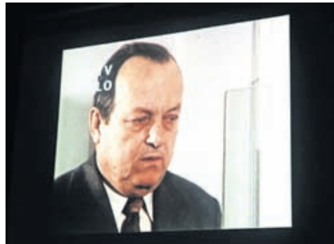
Arhivski posnetek Vlasta Kopača RTV Slovenija v filmski projekciji

Največje, najbolj trajne in najgloblje pa so Kopačeve sledi na Veliki planini. To je kamniška planina, planina naših pastirjev in ljudi, ki so