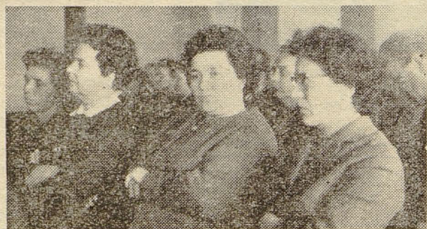
Tudi članice ZB so bile zastopane na konferenci