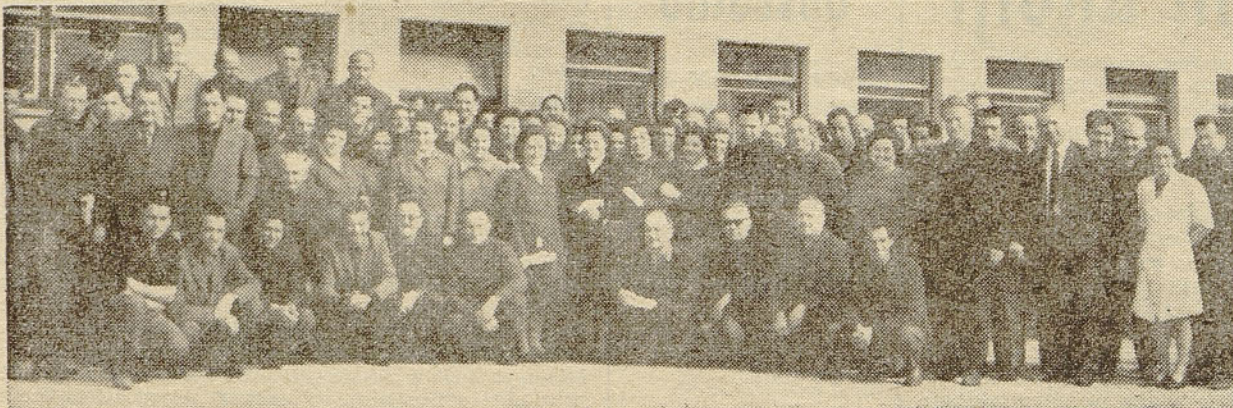
Pred zborovanjem članov aktiva ZB je fotokamera komaj zajela številne udeležence