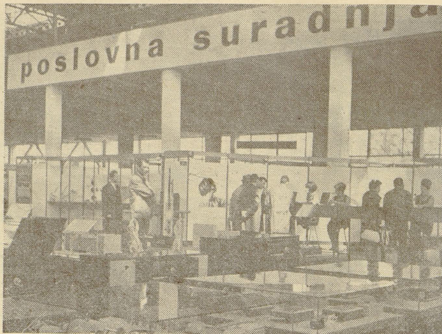
K članku na 1. strani: pogled na del razstavnega prostora v paviljonu 6, kjer so razstavljala na letošnjem zagrebškem velesejmu že osmič ISKRA, RIZ in »Rudi Čajavec« v okviru poslovne sodelovanja

Pismene ponudbe, z ustreznimi dokazili o izobrazbi in sposobnostih naj interesenti pošljejo ali oddajo v organizacijsko-kadrovskem oddelku Zavoda za avtomatizacijo do 15. maja 1967.