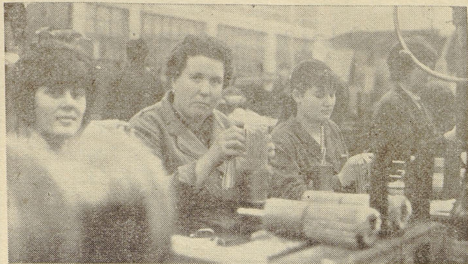
N. Gorica — z linije rotorja; faza dela: paličasto navitje

sredstev. Razprava je nakazala niz problemov, ki so se največ dotikala razporejenosti članov ZB na delovnih mestih, aktivnosti v samoupravnih organih, borčevskemu dodatku in revolucionarnem duhu, ki naj preveva vse člane ZB pri uresničevanju misli reforme, večji proizvodnji in boljši kvaliteti. Če vzamemo v okvir vse govornike, od borcev v novogoriški tovarni, predsednika občinskega odbora ZB, zastopnikov samoupravnih organov in političnih organizacij, direktorja tovarne ter predsednika ZB združenega podjetja — ne