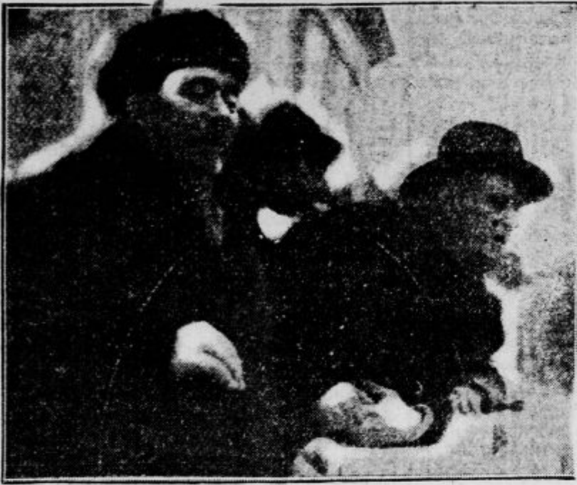
Stjepan Radić in Svetozar Pribičević govorita z balkona Kazine.