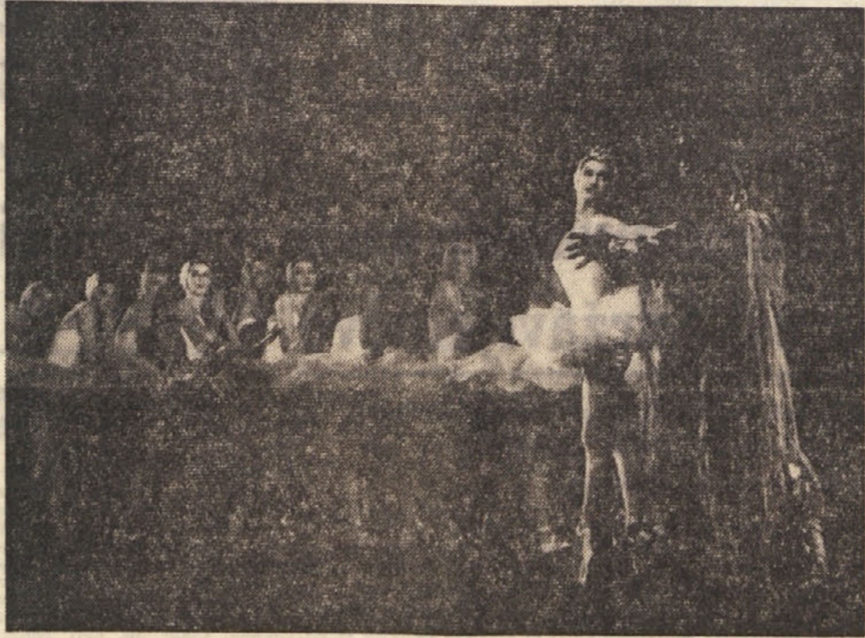
V gledališču 'Verdi' nastopi danes in tri naslednje dni London's Festival Ballets. Na sliki prizor iz II. dejanja Čajkovskega 'Labodjega jezera'...