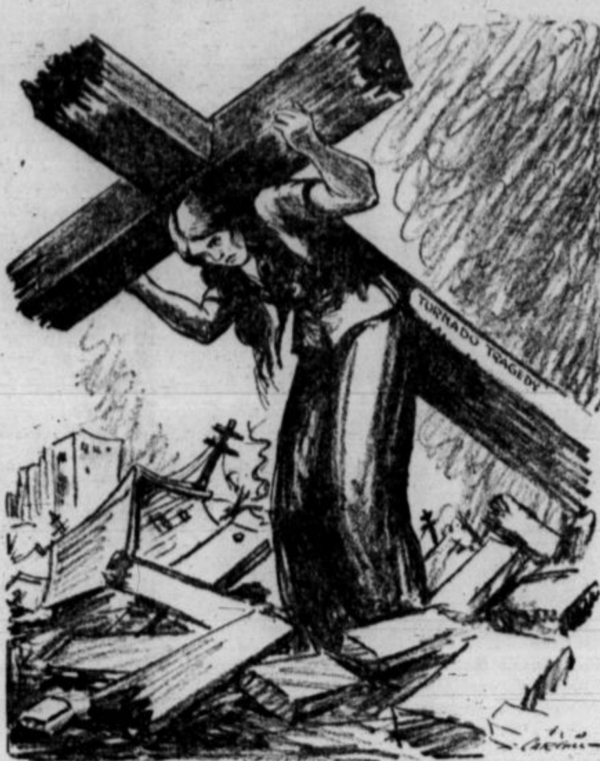
Vsako pomlad se v južnih državah dogajajo sifoviti viharji, ki ugonablajo življenja in imovino.