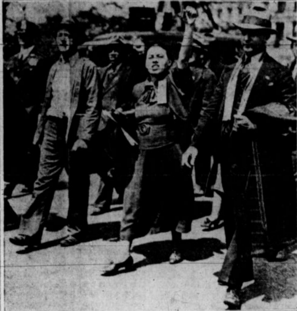
American Workers' Alliance, v kateri so organizirani brezposelni, je imela v prvi polovici tega meseca v Washingtonu svojo drugo splošno konvencijo. Udeležilo se je je okrog 500 delegatov. Privedli so demonstracijo pred Belo hišo, toda predsednika Roosevelta ni bilo doma. Deputacijo demonstrantov je sprejel eden njegovih tajnikov, kateremu je izročila zahteve brezposelnih. Obiskala je tudi nekaj drugih vladnih uradov. Bila je povzod hladno sprejeta, češ, mar ne stori vlada vse kar more, da pomaga nezaposlenim? Delegati so bili kajpada povsem nasprotnega mnenja, in po pravici.