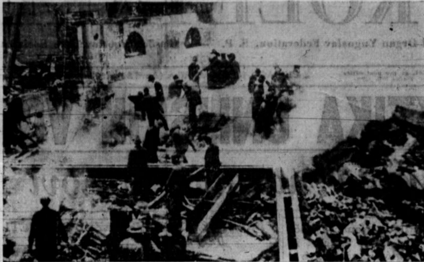
V prejšnji številki na tem mestu je bila slika o škodi v mestu Cordele, Ga., ki jo je povzročil vihar. Gornja slika je iz mesta Gainesville v isti državi. Kar ni uničil vihar, so dokončali plameni. Na sliki so gasilci in drugi, ki iščejo trupla na pogorišču. V viharju in požaru je bilo izgubljenih mnogo življenj.