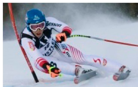
Trenutni vrstni red v svetovnem pokalu, skupno (po 6 tekmah)