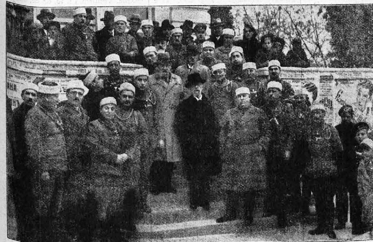
S delegatima Ju- naka na kongresu u Staroj Zagori