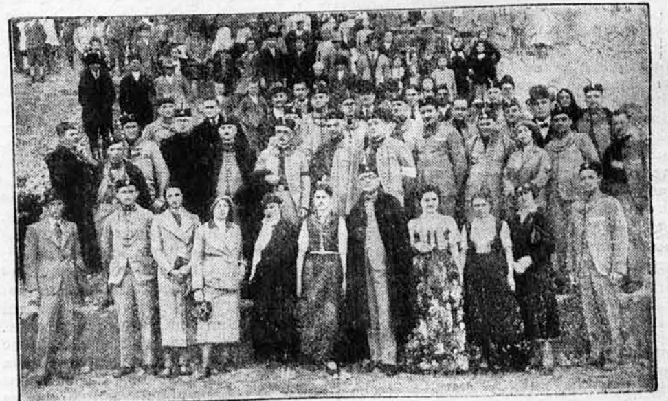
Na subotičkom sletištu

Uz oduševljene manifestacije upućen je tada s ove svečanosti pozdravni telegram Njegovom Veličanstvu Kralju Petru II sledećeg sadržaja: Maršalatu Dvora, Beograd. — Svo- me Najvišem Pokrovitelju, Vrhovnom