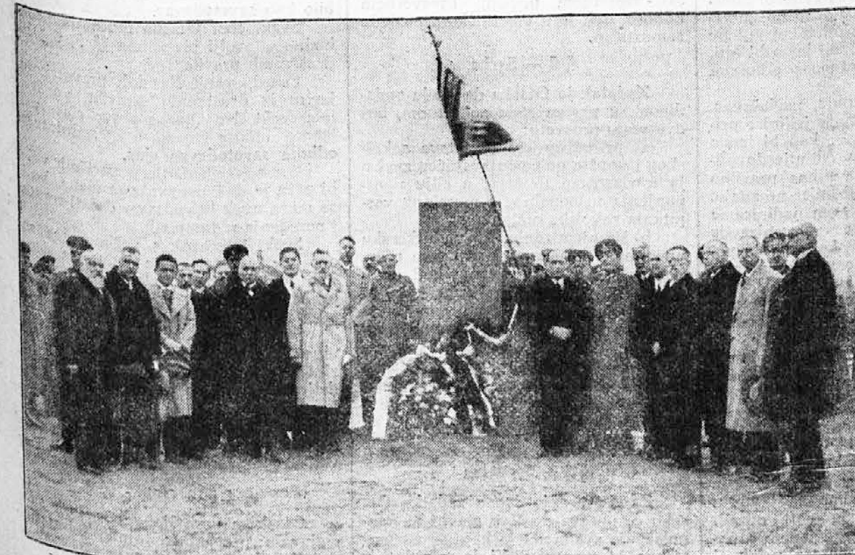
Na vojničkom groblju u Sofiji na- kon polaganja ve- naca na spomenik bugarskih palih boraca