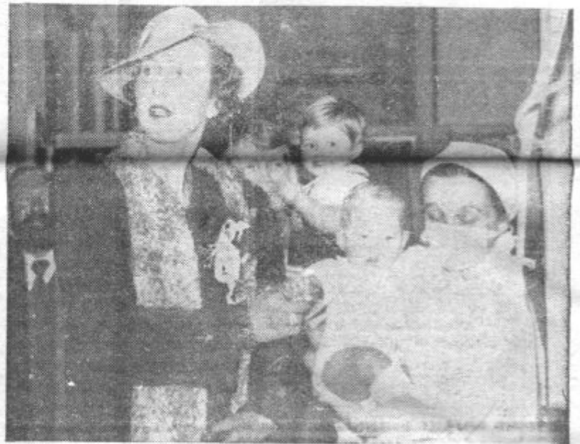
PIEMONTSKA PRINCESA V PARIZU. Princesa Marija José, soproga italjanskega prestolonaslednika Umberta je te dni posetila Pariz, kjer je prisostvovala odkritju spomenika belgijskemu kralju Albertu I. Ob tej priložnosti je tudi obiskala zavod za otroke