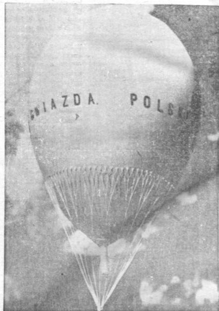
KONEC POLJSKEGA STRATOSFERNEGA BALONA. Plašč »Poljske zvezde«, ki je eksplodirala pred nameravanim vzletom v stratosfero. Zaradi tega nastala škoda gre v milijone