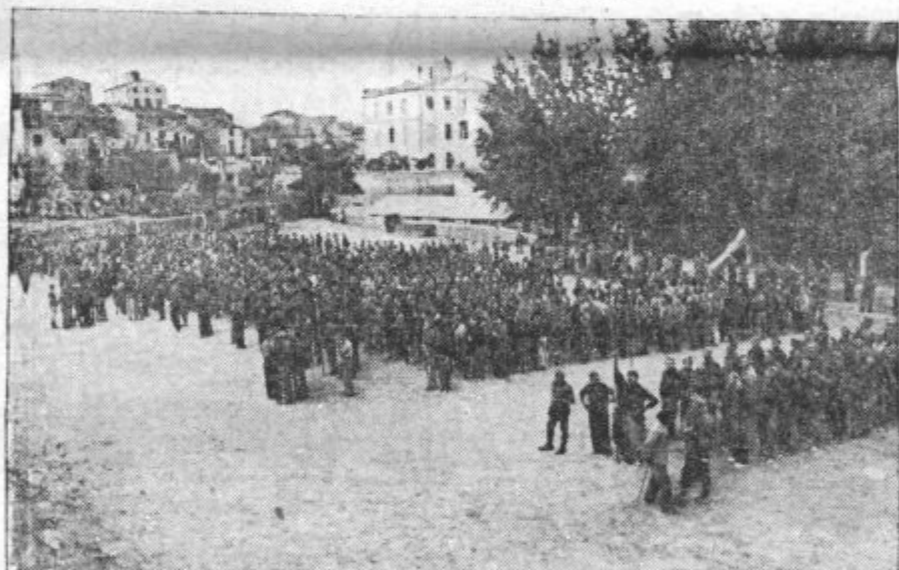
PROSTOVOLJCI ODHAJAJO. Odkar je Italijanska vlada odpoklicala večje število prostovoljcev iz Španije, je tudi republikanska vlada Španije skrčila mednarodno brigado in poslala te borce domov