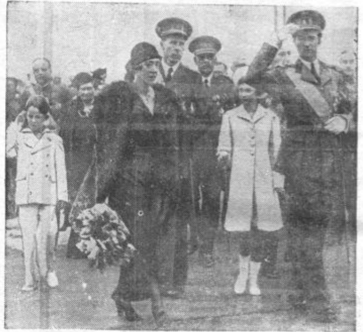
BELGIJSKA KRALJEVSKA DRUŽINA po odkritju spomenika. V ospredju vidimo kraljico-vdovo Elizabeto, poleg nje kralja Leopolda, zadaj stoji Brabantski vojvoda

V Parizu so odkrili prošli teden spomenik prijatelju Francije, junaškemu pok. belgijskemu kralju Albertu I.