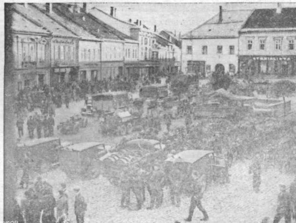
NEMŠKE ČETE V POLICKI. Vojaški oddelki nemške vojske so med drugim zasedli tudi mesto Polička, ki šteje 5000 čeških prebivalcev, med katerimi je samo 10 Nemcev