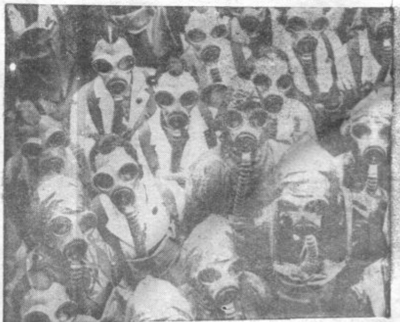
ANGLIJA SE PRIPRAVLJA PROTI PLINOM. V angleških tvornicah so dobili vsi delavci protiplinske maske in se morajo vezhati, kako se je treba zadržati ob plinskih napadih