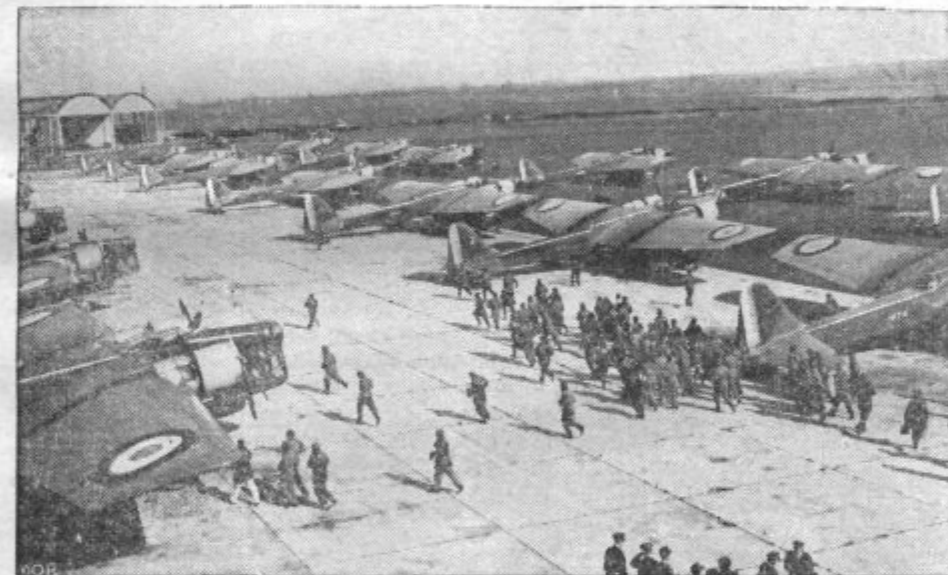
FRANČOSKA LETALA PRED ODLETOM V AFRIKO. Pogled na vojaške aeroplane, zbrane na letališču Le Bourgetu pri Parizu