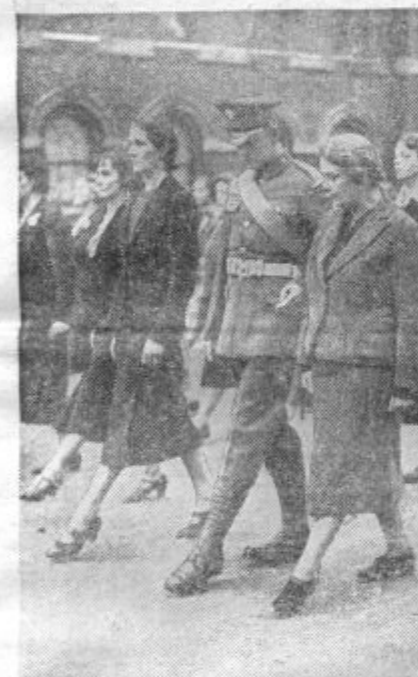
ŽENSKI VOJAKI V ANGLIJI. V Angliji zbirajo prve članice bodočih ženskih bataljonov. Na sliki jih vidimo z narednikom pri vežbanju v korakanju