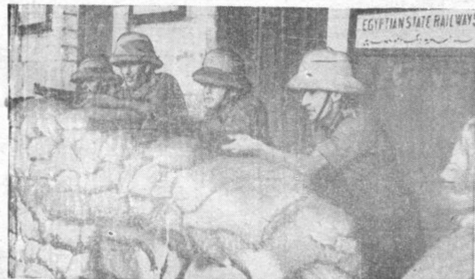
ANGLEŠKI VOJAKI SO ZASEDLI VES JERUZALEM. Oddelki angleške suhozemne vojske stražijo železniško postajo v Lidi pri Jeruzalemu, kjer so uporniki povzročili, da se je iztiril vlak. Obrambna postojanka je zavarovana z vrečami peska