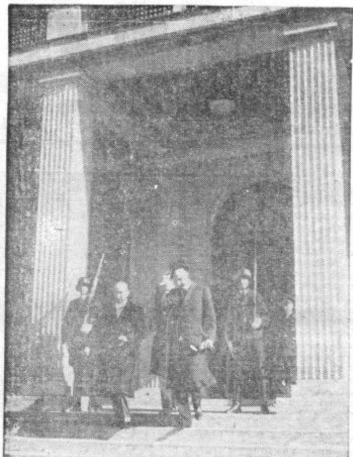
ČVALKOVSKY PRI HITLERJU. Novi čsl. zunanji minister Čvalkovsky je obiskal nemškega drž. kancelarja v Monakovem, kjer mu je razložil smernice nove zunanje politike čsl. države. Na sliki vidimo ministra v trenutku, ko odhaja iz Hitlerjeve palače