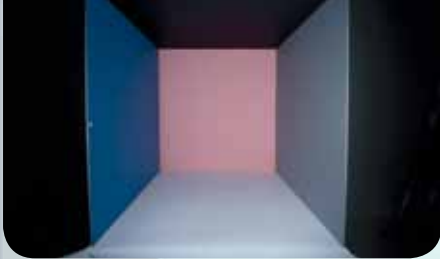
Slika 1: Fotografija notranjosti osvetljene komore.