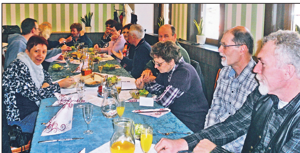
Z občnega zbora, na katerem so med drugim govorili tudi o tem, da jih je strah prihodnosti.