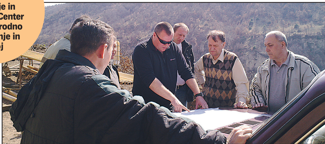
Mariovo, projektantska skupina Premogovnika in investitorji med ogledom raziskovalnih del.

»Izjemno sem zadovoljen z uspešno opravljeno revizijo projekta in