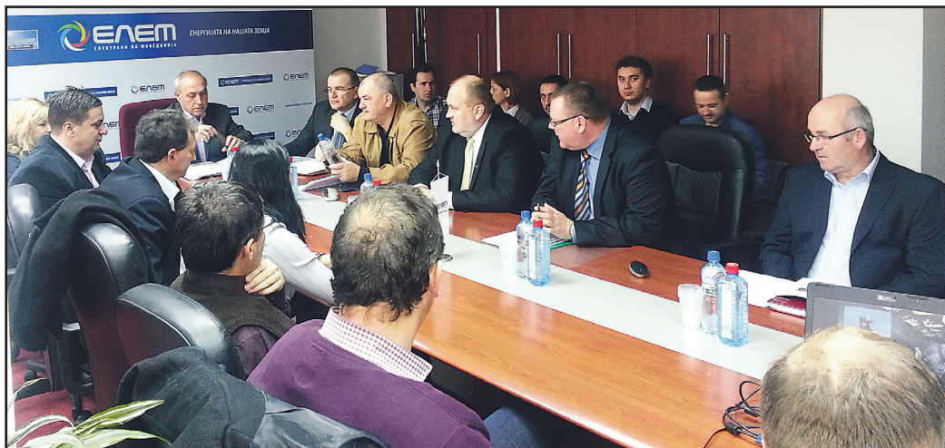
Z revizijske razprave marca v Skopju.

Na reviziji je sodelovalo precej strokovnjakov, tudi profesorji rudarske stroke iz Štipa in skopskega gradbenega inštituta, ki so opravili raziskovalna dela (vrtanje, interpre-