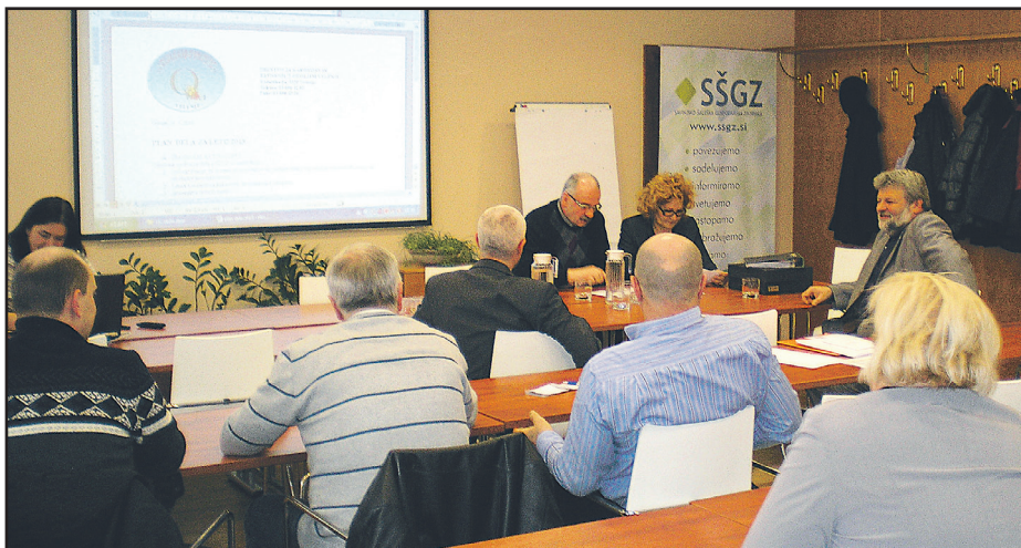
Zborovali so v prostorih Savinjsko-šaleške gospodarske zbornice.

Sicer pa je društvo na 15. občnem zboru v četrtek pregledalo poslovanje preteklega leta ter potrdilo načrt dela za leto. V osnovi bodo obdržali »železni repertoar«: izvajanje izobraževanj o po-