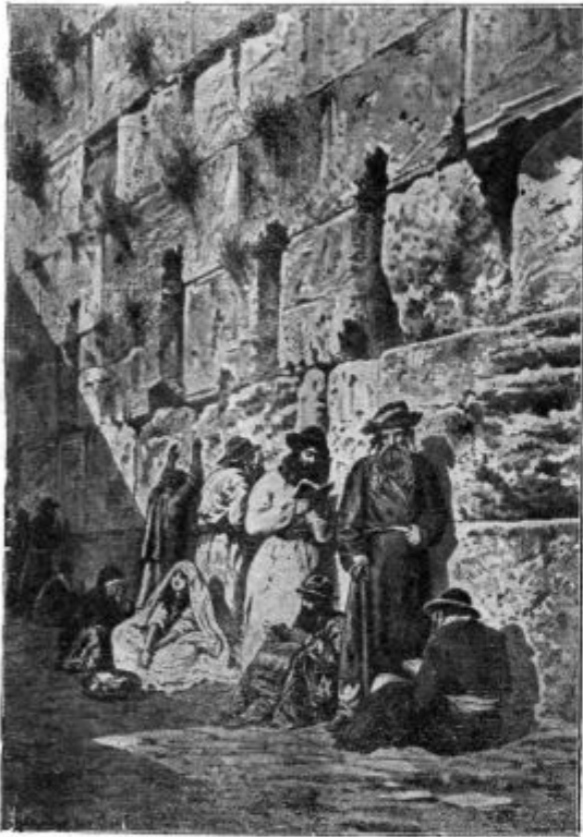
Judje jokajo nad Jeruzalemom.