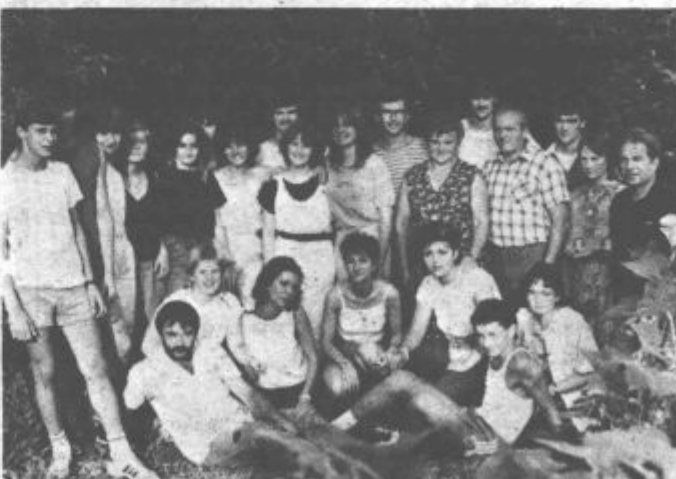
Mladi so navezali prijateljske vezi, ki jih gotovo ne bodo pretrgali