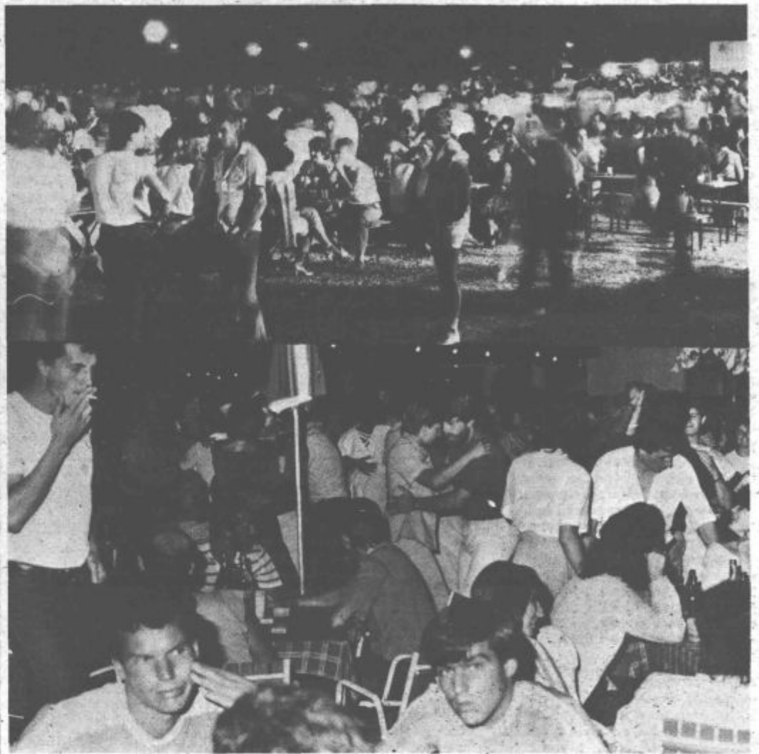
Prva noč ob velenjskem jezeru je za nami. Privabila je množico obiskovalcev, ki so z nje odnesli bolj ali manj prijetne vtise, pokazala pa je tudi na razne pomanjkljivosti, ki so jih prizadevni organizatorji tokrat spregledali, že prihodnje leto pa bo

do odpravljene. Tako se nam obeta pestrejša, kakovostnejša prireditve, ki bo privabila še več gostov in prijetno popestrila naše sicer precej dolgočasno poletje.