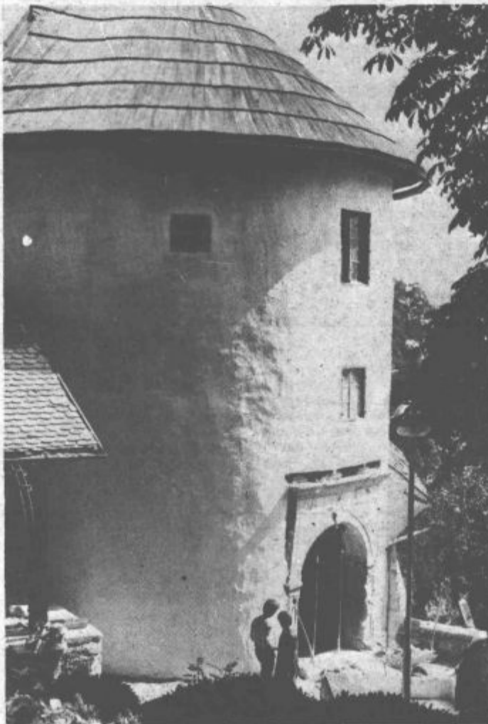
Renesančni vhod bodo obnovili

V tem poletju so se lotili še »obdelave celotne Saleške doline« in zbiranja različnih podatkov predvsem o zgodovini v preteklih 85 letih, se pravi od začetka tega stoletja dalje. Med to nalogo, ki bo trajala sicer nekaj dalje, bodo obiskali vsa naselja v dolini, si zapisali, kaj bodo povedali najstarejši krajanje Saleške doline, o gospodarskih, političnih, kulturnih oziroma kakršnihkoli drugih razmerah pred desetletji v dolini, pač kolikor se jih bodo spominjali. Ob teh obiskih pa bodo zabeležili tudi vso premično kulturno dediščino, ki jo imamo v Saleški dolini. (vos)