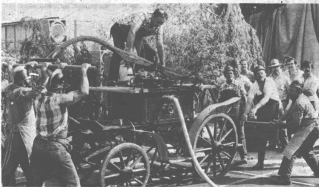
Gasilci iz Letuša